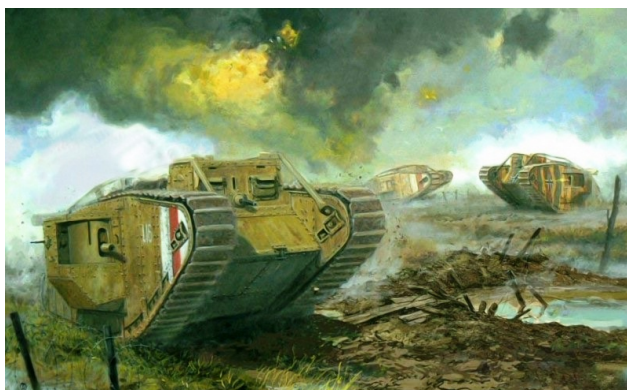
Prvá tanková bitka

Prekážky z ostnatých drôtov, guľomety a mohutné delostrelectvo umožňovali vybudovať takú silnú obranu, že ju nebolo možné útokom prelomiť. Útočiacie jednotky použili jedovaté otravné plyny, ale len zriedkakedy dosiahli úspech. Tanky, ktoré po prvýkrát nasadili Briti roku 1916, nič nezmožili proti ostnatým prekážkam a guľometom a navyše boli veľmi nespoľahlivou zbraňou. Lietadlá dosahovali väčšie úspechy a používali sa na prieskum nepriateľských pozícií, usmerňovanie delostreleckej paľby a bombardovanie. Nemecké letecké eso Manfred von Richthofen, prezývaný „červený barón“, sám zostrelil až 80 nepriateľských lietadiel.