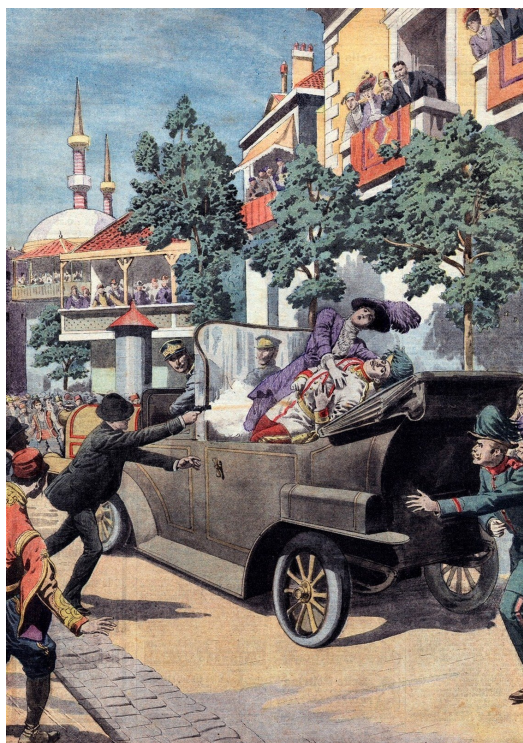
Atentát na rakúskeho arcivojvodu Františka Ferdinanda

Roku 1914 bola Európa rozdelená do dvoch veľkých aliancií. Rakúsko uzavrelo spojenectvo s Nemeckom na obranu svojich záujmov proti záujmom Ruska na Balkáne. Francúzsko sa spolu s Ruskom snažili zabrániť rastúcej rozpínavosti Nemecka. 28. júna 1914 spáchal srbský nacionalista atentát na rakúskeho arcivojvodu Františka Ferdinanda, čo podnietilo Rakúsko-Uhorsko k vyhláseniu vojny Srbsku. Srbsko zase požiadalo o pomoc Rusko, ktoré potom vyhlásilo vojnu Rakúsko-Uhorsku. Následne sa do vojny zapojilo Nemecko a Francúzsko. Veľká Británia vstúpila do vojny, keď Nemecko napadlo Belgicko.