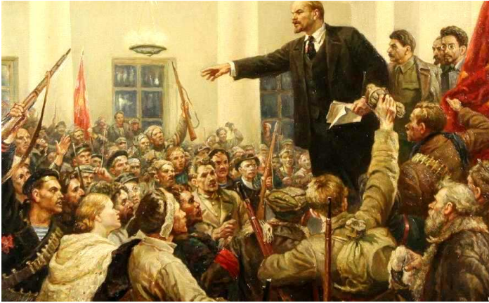
Ruská revolúcia v novembri 1917