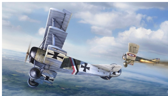
Nemecko-francúzsky vzdušný súboj