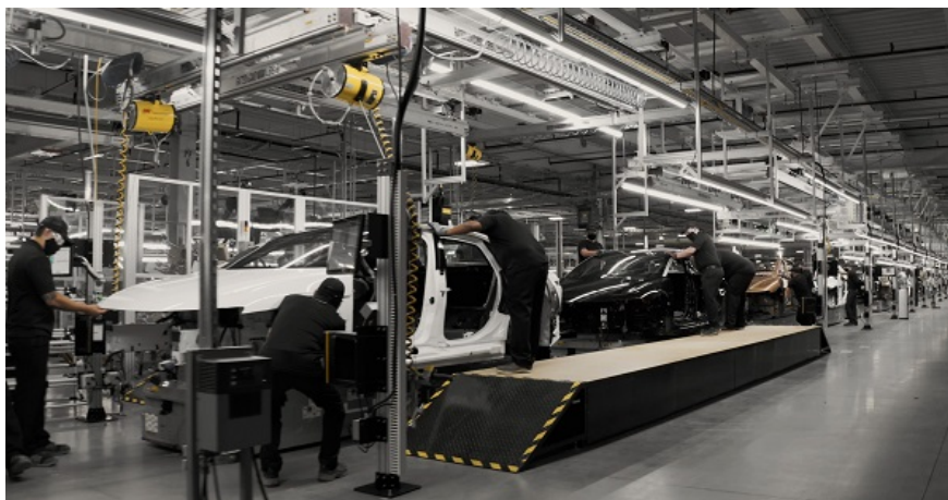
Vývoj pásovej, resp. sériovej výroby