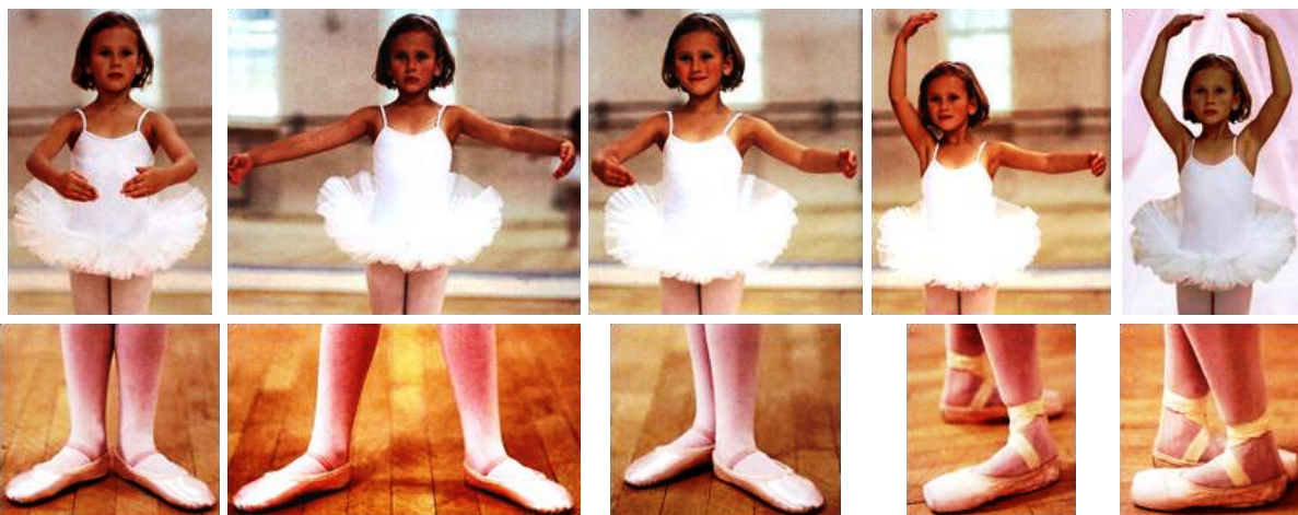
- I. pozícia,

Detail držania rúk postoja/pózy a postavenia nôh pri 5 pozíciách/pózach/postojoch: