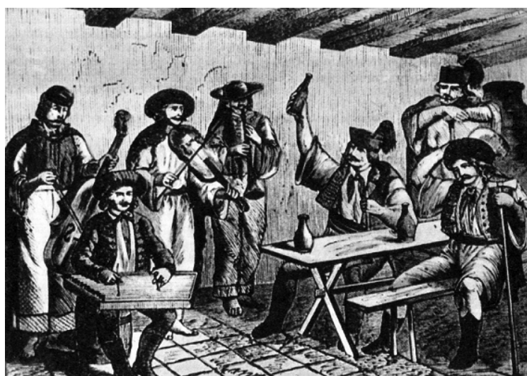
Cimbalová muzika s klarinetom z konca 19. storočia