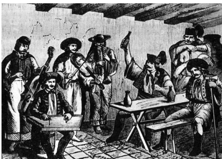
Cimbalová muzika s klarinetom z konca 19. storočia