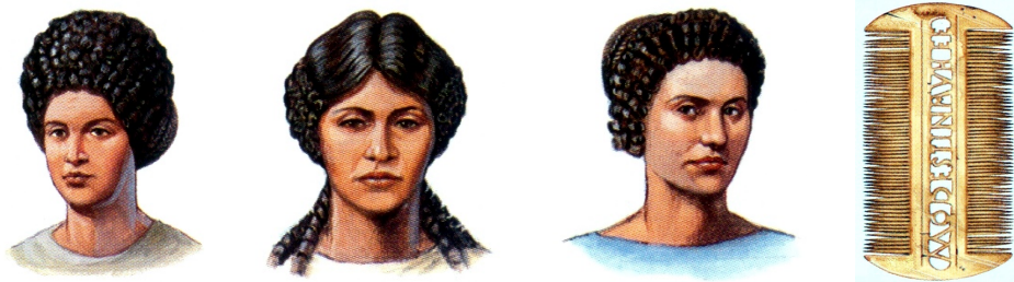
Bohaté ženy trávili pri úprave vlasov veľa času. Niektoré náročné účesy držali tvar len vďaka kostným či slonovinovým ihliciam.