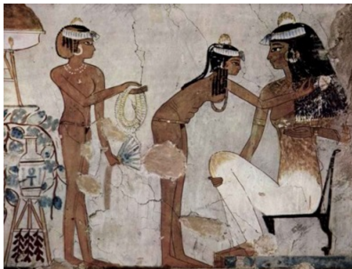
Žehlenie vlasov v starovekom Egypte

dopriali niekedy aj trikrát za deň. Do vody si pridávali vonné oleje [5], - oleje používali Egypťania aj ako ochranu pred horúcim slnkom a natierali si nimi celé telo. Na rozdiel od bežných ľudí si faraóni a iní vznešení obyvatelia Egypta dávali veľmi záležať na parfémových dózach[6], - bola na stene tébskeho chrámu zasväteného kráľovnej Hatšepsovet vytvorená maľba, ktorú historici pokladajú za prvú zmienku o parfémoch. Zobrazuje egyptskú flotilu, ktorá vyplávala asi pred 3 500 rokmi, aby priviezla myrhu a iné exotické aromatické látky z krajiny Punt (kadidlo a myrha[7] boli hlavnými plodinami starovekého voňavkárstva a pestovali sa iba v južnej Arábii a Somálsku). ďalšie parfémové ingrediencie, napríklad zázvor, korenie a santalové drevo, dovážali Egypťania z Indie. Jazmín si pestovali sami, - kňazi, hlavne z hygienických dôvodov, nosili vyholené hlavy. Tí čo vlasy mali, používali hrebene vyrobené z dreva a kostí. Tie plnili hlavne odvlhčovaciu funkciu,