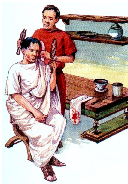
Riman u holiča

- Rimania používali aj líčidlá. Obdivovali svetlú a hladkú pleť. Nalepovacie kúsky látky, ktoré sa nazývali „splenia“, slúžili na zakrývanie materských ramienok. Veľa líčidla nepoužívali len ženy ale aj muži. Miesto perleťového púdro sa používala drvená krieda alebo olovnatá bieloba, miesto tieňov využívali červený oker[21], namiesto rúžu mali rastlinné šťavy a na zvýraznenie očí a očných viečok popol zo spáleného dreva a antimónový prášok, - Rimanky obľubovali a veľmi si cenili blond vlasy. Väčšina obyvateľov totiž mala, tak ako ostatní obyvatelia Stredomoria, od narodenia nepoddajné, tmavohnedé vlasy[22]. Aplikovali preto na ne rôzne rastlinné výťažky a tie si potom nechávali vyschnúť na priamom slnku. Často sa na zosvetľovanie používala zmes octu a lúhu. Na odstránenie chĺpkov používali rôzne holítko, pemzu a tiež depilačné krémy. Bežné boli aj klieštiky na vytrhávanie obočia, - zámožní muži navštevovali holiča denne. A to aj napriek tomu, že holenie a strihanie vlasov a fúzov bolo vďaka tupým a skorodovaným nástrojom - veľkými záhradnými nožnicami (za čias starých Rimanov nepoznali ešte ľudia nožnice ani britvy a k tomu strihali vlasy a fúzy po jednom), bolestivé a krvavé. Holičstvo totiž bolo miestom, kde sa muži dozvedali a preberali rôzne novinky a klebety. Rímski muži bývali spravidla ostrihaní nakrátko a okrem tých najstarších aj nahladko oholení,