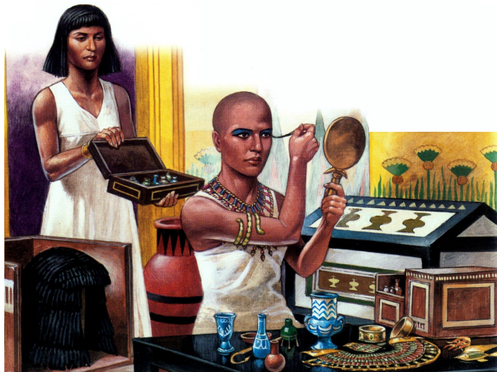
Líčenie v starovekom Egypte

- sa začala písať história mejkapu. Pre tvár vznešených Egypťanov (žien aj mužov) boli okrem iných znakov typické aj zelenou medenkou natreté viečka a tmavočierne linky okolo očí. Minerálna zmes s uhlíkovým základom - kajal, mala hneď niekoľko funkcií. Jej sýtočierna farba ochraňovala ľudské oko pred nepriaznivými účinkami ostrého afrického slnka a zároveň mala[2] aj dezinfekčné účinky. Sami Egypťania verili, že kajal má zázračné liečivé schopnosti. Mysleli si, že dokáže zlepšiť slabý zrak a zabraňovať očným infekciám. Preto kajal nanášali starovekí Egypťania aj deťom[3],