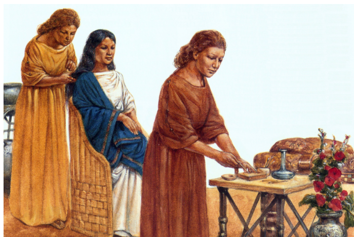
Líčenie v starovekom Ríme