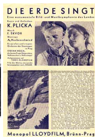
Z filmu a o filme Zem spieva

Roku 1935 - bol natočený známym českým režisérom Martinom Fričom (1902-1968) prvý zvukový film Jánošík . Hlavnú úlohu v ňom vytvoril Paľo Bielik (1910-1983), ktorý sa po 2. svetovej vojne stal prvým slovenským profesionálnym režisérom.