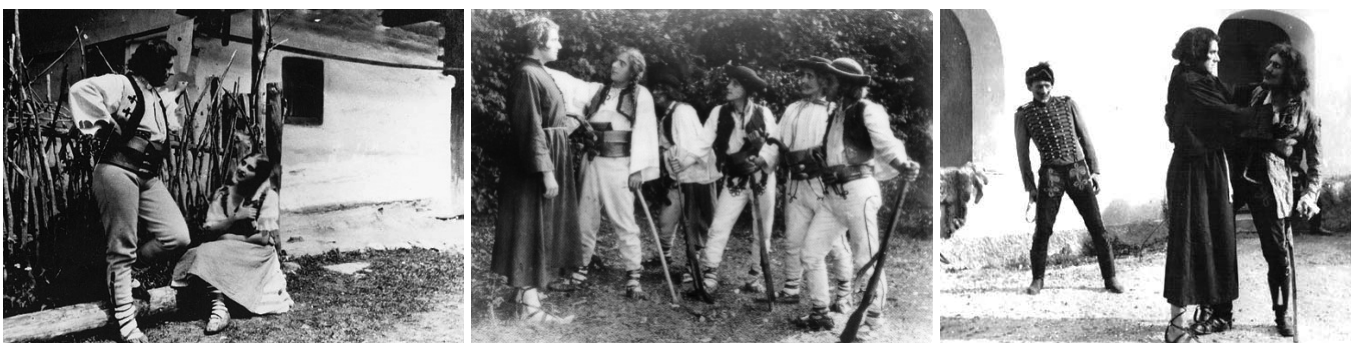
Scény z filmu Jánošík natočenom v roku 1921