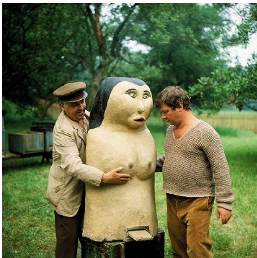
Ukážka z filmu Ja milujem, ty miluješ

Roku 1990 - odišla po dvadsiatich šiestich z hereckého prostredia a stala sa diplomatkou Magda Vášáryová (1946).