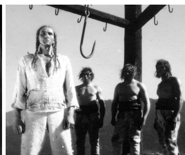
Z filmu Jánošík natočenom v roku 1935

Roku 1947 - natočený prvý povojnový slovenský film Varúj! . Režiroval ho Martin Frič.