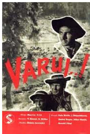
Plagát k filmu Varúj!

Roku 1949, 9. júna - v Bratislave boli zriadené: VŠMU a VŠVU.