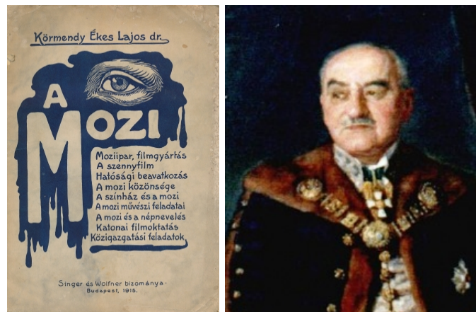
Prvá kniha o filme a jej autor

Roku 1915 - vyšla prvá kniha o filme na Slovensku. Autorom bol mestský radca maďarskej národnosti Lajos Ékesa Körmendy (1876-1951). Kniha mala názov A mozi (Kino).