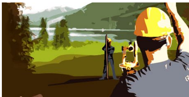
Práca geodeta dnes