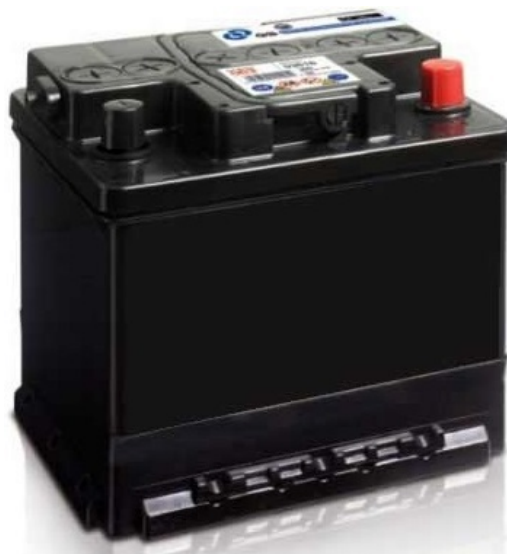
Akumulátor do auta

Všetky významy pojmu Akumulátor , Akumulátory , kapacita akumulátora , olovený akumulátor