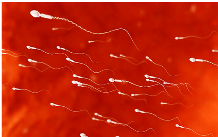
Kvalitná mužská spermia

Spojením spermie s vajíčkom vzniká zárodok nového jedinca ( oplodnenie ).