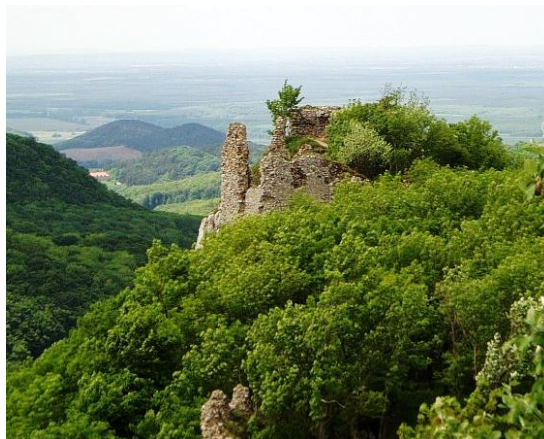
Hrad Ostrý kameň dnes

Roku 1498 - obec sa spomína pod názvom Kwthi.