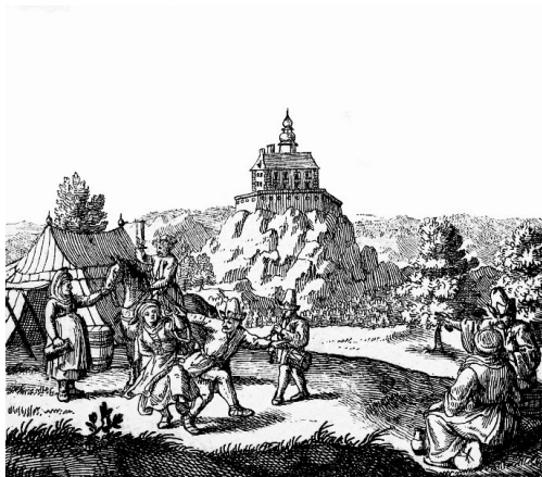
Hrad Ostrý kameň v 17. storočí

Roku 1468 - obec sa po prvý raz spomína pod názvom Kuth. V tej dobe patrila k hradu Ostrý kameň a holičskému panstvu.