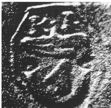
Originálny odtlačok pečatidla z roku 1615

Z roku 1615 - je listina z pečatidlom, na ktorom sa zachoval znak obce. Má poľnohospodársky motív - „lemeš“ [1] a nad ním „čerieslo“ [2] . Nad štítom sa nachádzajú písmená K-I, čo znamená „ Kutensis insigne “ [3] .