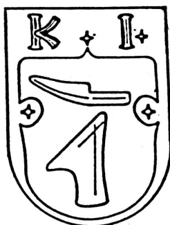
Prvý kútsky erb

Z roku 1615 - je listina z pečatidlom, na ktorom sa zachoval znak obce. Má poľnohospodársky motív - „lemeš“ [1] a nad ním „čerieslo“ [2] . Nad štítom sa nachádzajú písmená K-I, čo znamená „ Kutensis insigne “ [3] .