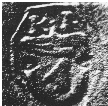
Originálny odtlačok pečatidla z roku 1615

Z roku 1615 - je listina z pečatidlom, na ktorom sa zachoval znak obce. Má poľnohospodársky motív - „lemeš“ [1] a nad ním „čerieslo“ [2] . Nad štítom sa nachádzajú písmená K-I, čo znamená „ Kutensis insigne “ [3] .