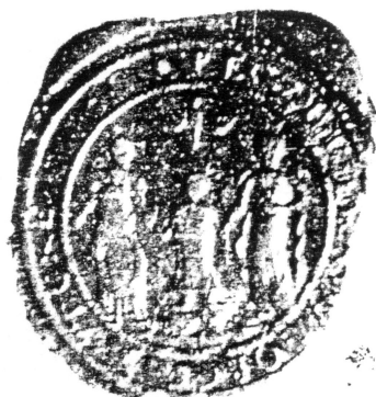
Pečatidlo z roku 1760

Z roku 1760 - je pečatidlo, na ktorom sa ako znak obce zachoval motív svätej rodiny. Tri postavy svätých sa nachádzajú aj na pečatidlách z roku 1880 a 1892.