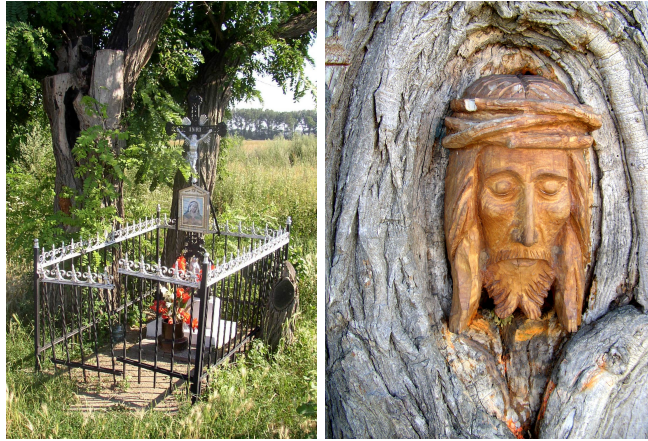
Kríž s obrázkom Panny Márie a drevená plastika Ježiša Krista osadená v kmeni stromu