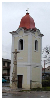
Kútska zvonica dnes