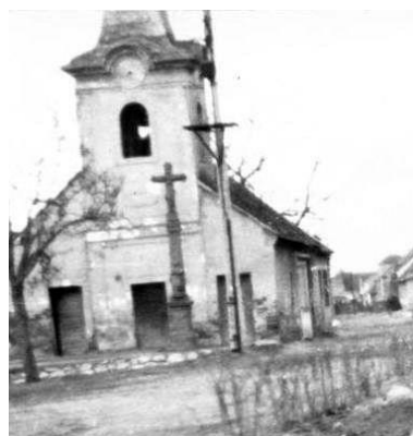
Kútska zvonica v 20. storočí (pred rekonštrukciou)

Pred zvonicom stojí kamenný kríž. Spomínal sa už v roku 1738.