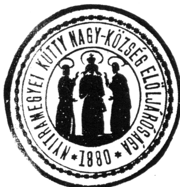
Pečatidlo z roku 1880

- na pečatidle Kútov z tej doby sa nachádzali postavy troch svätých.