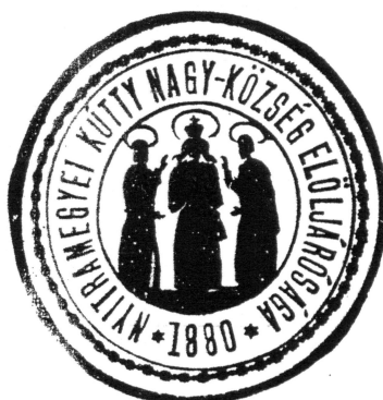
Pečatidlo z roku 1880

- na pečatidle Kútov z tej doby sa nachádzali postavy troch svätých.