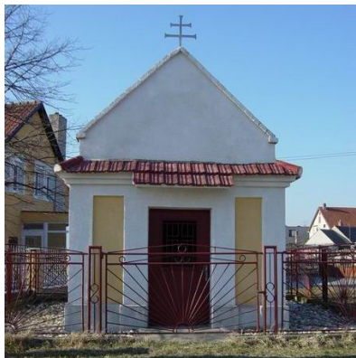
Kaplnka sv. Anny