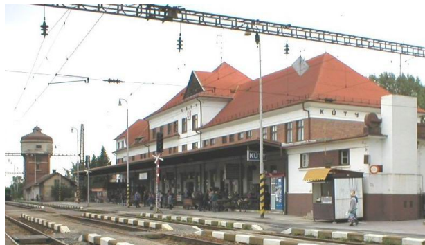
Budova železničnej stanice dnes