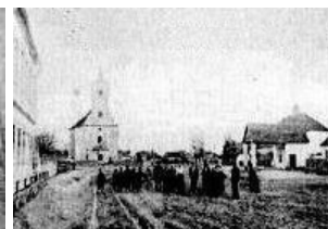
Iný pohľad na námestie z roku 1900

Roku 1901 - na železničnej stanici v Kútoch pribudli 4 dopravné koľaje a vzniklo dopravné spojenie Kúty - Břeclav.