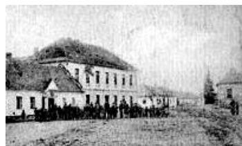
Hlavné námestie v roku 1900