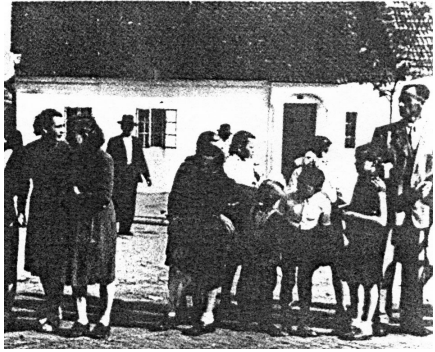
Dom s výpusťkou