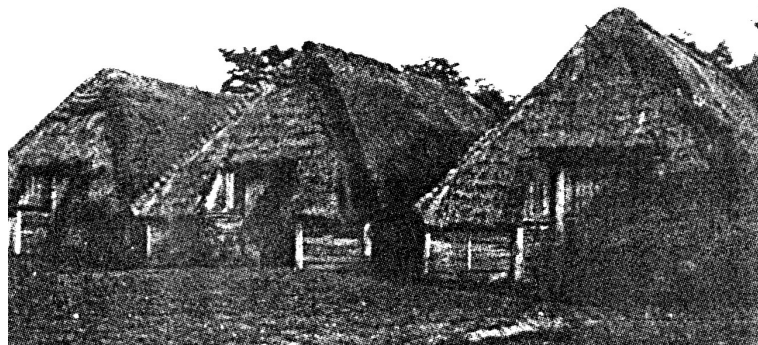
Kútske stodoly v minulosti

Stodoly sa v Kútoch stavali na miernych, neúrodných, piesočnatých vrškoch, aby nezaberali úrodnú zem a aby v nich nebolo vlhko. Väčšinou stáli medzi stromami, ktoré mali zachytiť prípadné letiace iskry ohňa. Slúžili tiež ako bleskozvod. Z obavy pred požiarom sa stavali ďaleko od domov. Keď zhoreli domy, stodoly zostali. Boli celé z dreva, pokryté slamou alebo doskami. Stodola mala obdĺžnikový tvar. Vchádzalo sa do nej „vrátami“ [7] , ktoré boli na obidvoch užších stranách. Uprostred bola „mlatovňa“ z ubitej hliny. Tu sa mlátilo v zime, keď už nebolo inej práce. Vnútri bolo šesť „úrebier“, na každom konci dve „plevničky“ [8] . Do úrebí sa dávalo obilie a slama, seno sa ukladalo na „holovi“ [9] alebo na „patro“ [10] . Strecha bola zakončená „nárožníkmi“. Na „kálenicu“ [11] sa dávalo „pazderi“. Zo strachu pred klincom v krmive pre dobytok, nepoužil sa pri stavbe stodoly ani jeden.