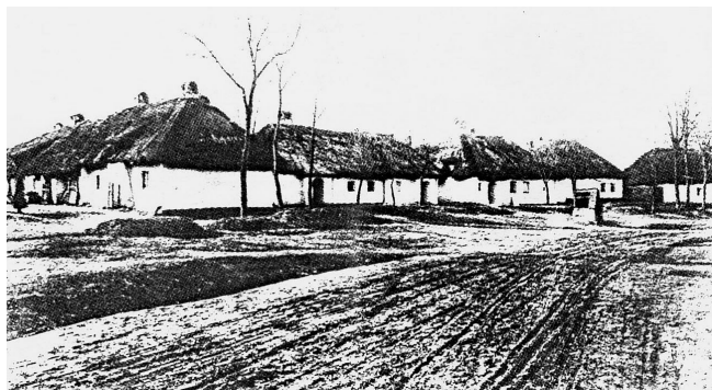
Kúty v roku 1905