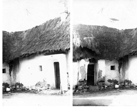
Staré kútske domy

Stodoly sa v Kútoch stavali na miernych, neúrodných, piesočnatých vrškoch, aby nezaberali úrodnú zem a aby v nich nebolo vlhko. Väčšinou stáli medzi stromami, ktoré mali zachytiť prípadné letiace iskry ohňa. Slúžili tiež ako bleskozvod. Z obavy pred požiarom sa stavali ďaleko od domov. Keď zhoreli domy, stodoly zostali. Boli celé z dreva, pokryté slamou alebo doskami. Stodola mala obdĺžnikový tvar. Vchádzalo sa do nej „vrátami“ [7] , ktoré boli na obidvoch užších stranách. Uprostred bola „mlatovňa“ z ubitej hliny. Tu sa mlátilo v zime, keď už nebolo inej práce. Vnútri bolo šesť „úrebier“, na každom konci dve „plevničky“ [8] . Do úrebí sa dávalo obilie a slama, seno sa ukladalo na „holovi“ [9] alebo na „patro“ [10] . Strecha bola zakončená „nárožníkmi“. Na „kálenicu“ [11] sa dávalo „pazderi“. Zo strachu pred klincom v krmive pre dobytok, nepoužil sa pri stavbe stodoly ani jeden.