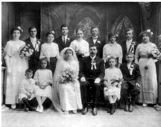
Svatba Kúcanov v New Yorku v roku 1913

- odišlo za prácou do USA asi 200 obyvateľov Kútov.