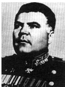
Rodion Jakovlevič Malinovskij

- 6. apríla - po dvoch dňoch bojov bola obec oslobodená vojskami ruského maršála Rodiona Jakovleviča Malinovského. Počas oslobodzovania padlo 108 vojakov a 8 miestnych občanov. Zhorelo 7 domov a 110 stodôl. Kostol zasiahlo až 75 delostreleckých granátov, poškodených bolo 25 domov.