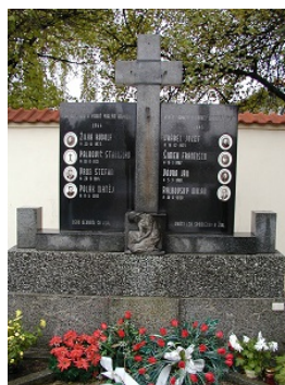
Pamätník obetiam druhej svetovej vojny kedysi a dnes