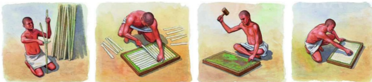
Výroba „papiera“ v starovekom Egypte

Z čistej celulózy sa vyrába filtračný, fotografický a ručný papier, z ľanového a konopného vlákna vznikajú veľmi jemné papiere. Ďalšími druhmi sú rôzne technické papiere, novinový papier, kartón a hrubšie lepenky.