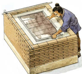
Ponorenie sita do buničiny