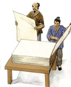
Lisovanie a sušenie