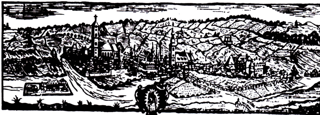
Pezinok v 16. storočí