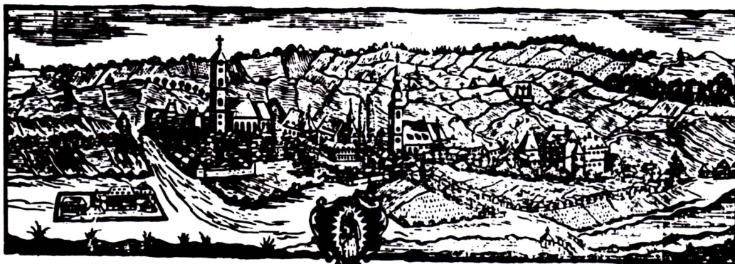
Pezinok v 16. storočí