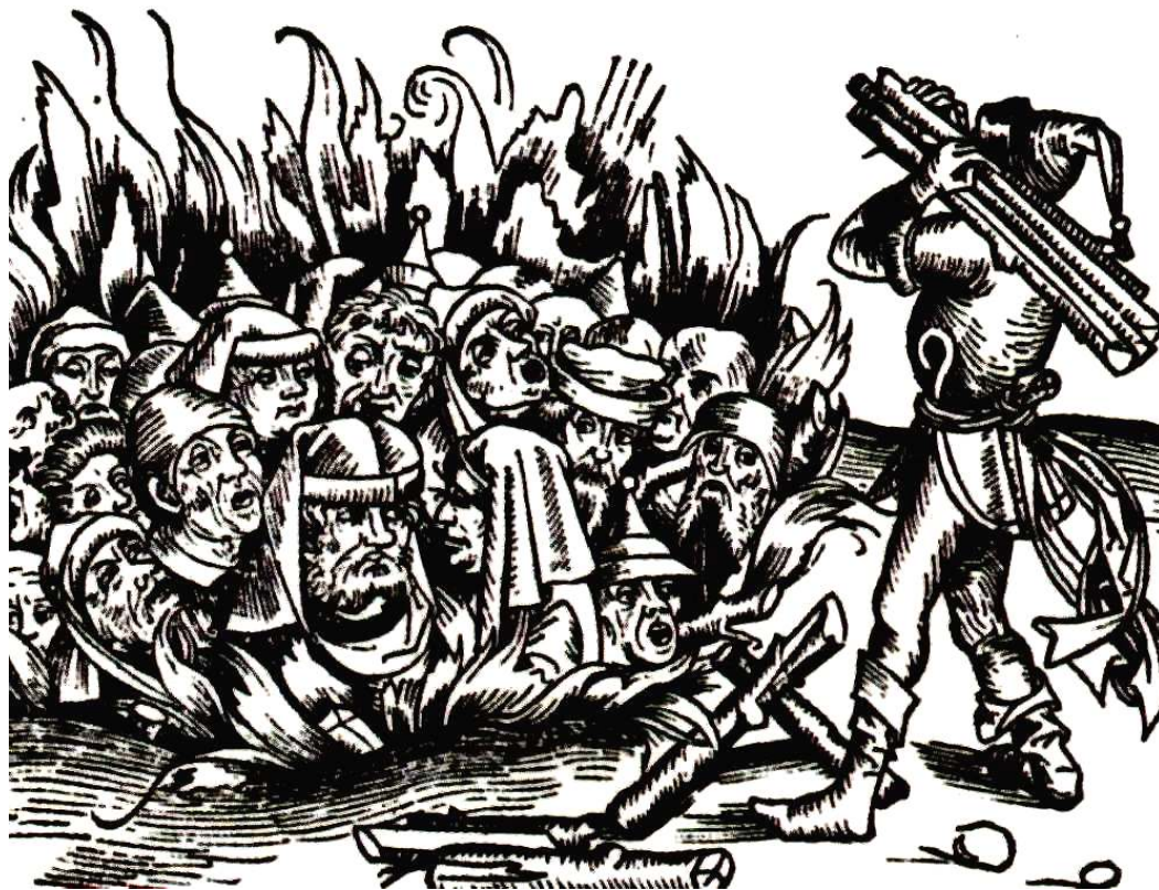
Prenasledovanie židov (obrázok z Norimberskej kroniky z roku 1493)