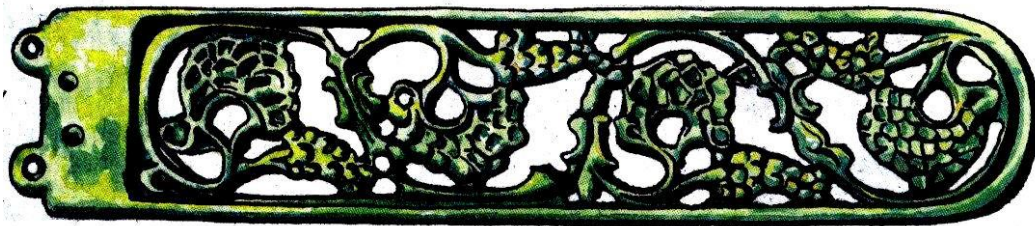
Motív vínnej révy na opasku z 8. storočia

V dobe 3 800-2 600 p.n.l. - oblasť Pezinka obýval ľud lengyelskej kultúry.