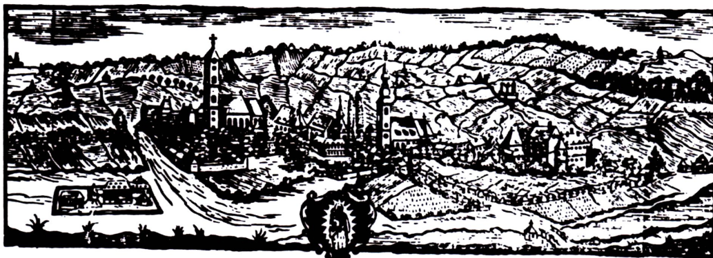
Pezinok v 16. storočí