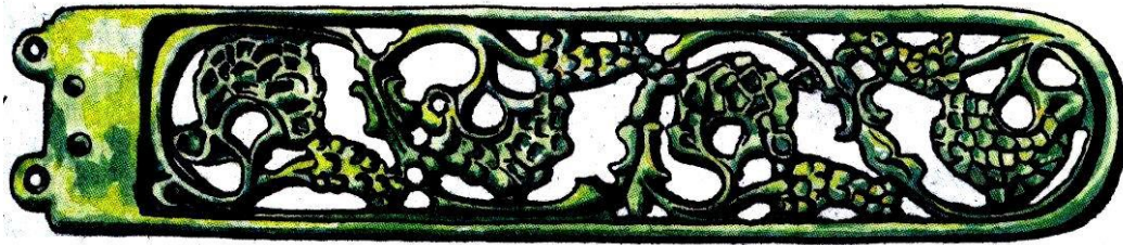
Motív vínnej révy na opasku z 8. storočia

V dobe 3 800-2 600 p.n.l. - oblasť Pezinka obýval ľud lengyelskej kultúry.