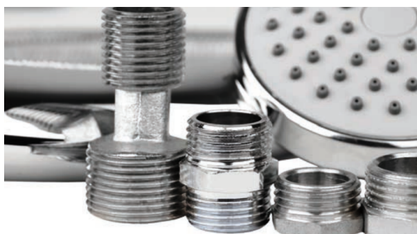
Vonkajší závit zhotoveý brúsením