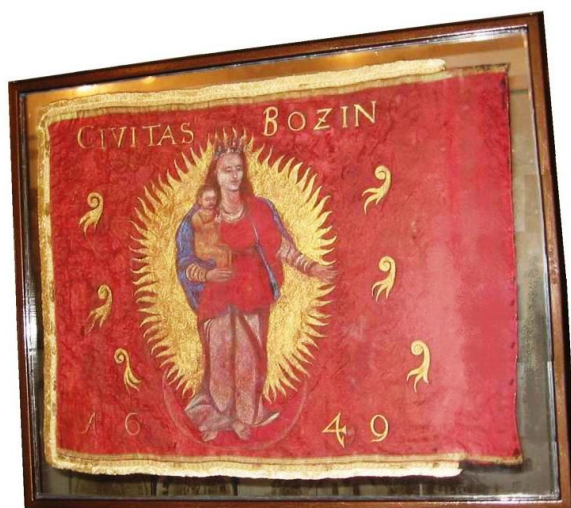
Vlajka mesta z roku 1649

- podľa privilégia Ferdinanda III. mal mať Pezinok v erbe sv. Annu s dieťaťom na rukách (v náručí). Na znakovkej zástave mesta (z toho roku zachovanej) sa nachádza obraz ženy, odetej v červených dobových šatách a zelenom plášti, s dieťaťom na pravej ruke. Ľavú ruku má žena natiahnutú. Na hlave má korunu, pod nohami srp mesiaca. Dieťa korunu nemá. Spoza týchto dvoch postáv vychádza svätožiara vo forme ohnivých jazykov. Nad postavami je nápis Civitas Bozin a pod nimi rok 1649.