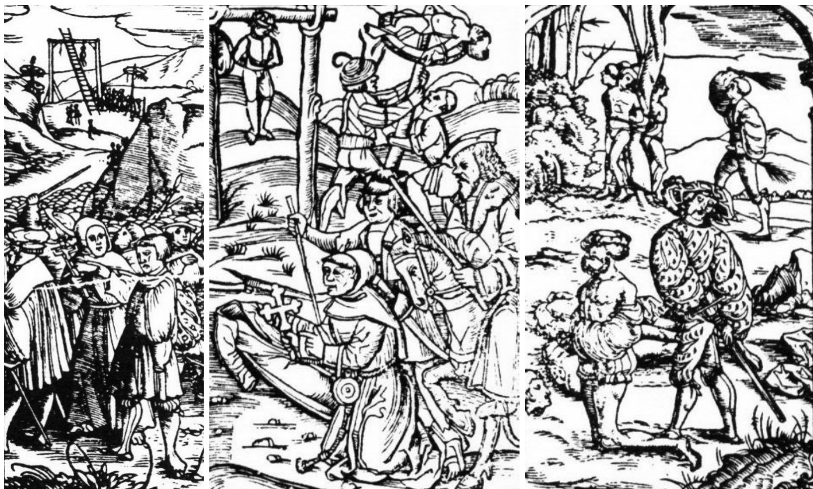
Cesta odsúdeného na popravisko a tresty smrti: obesením, vpletením do kolesa, státím a trest vyšľahaním

V rokoch 1615-1643 - boli okolo mesta vybudované hradby s vodnou priekopou. Dve hlavné výpadové brány boli zosilnené baštami.