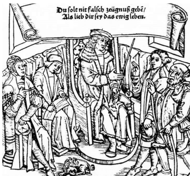
Zasadnutie súdu (v pozadí tresty smrti stredovekej justície) a prisaha svedkov pred súdom