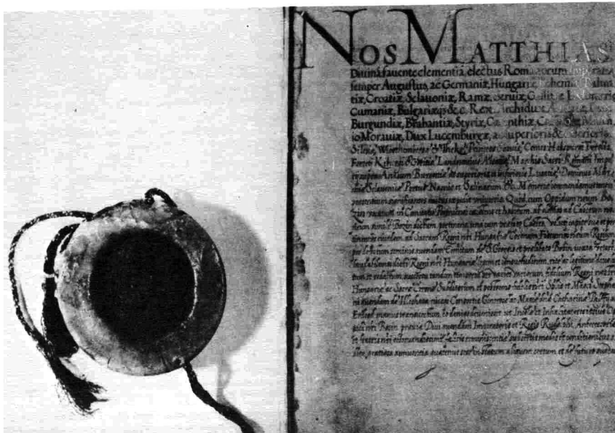
Privilégium kráľa Mateja II. pre slobodné kráľovské mestečko Pezínok z roku 1615

Roku 1620 - mesto požiarom úplne zničil cisársky veliteľ Bukvoy.