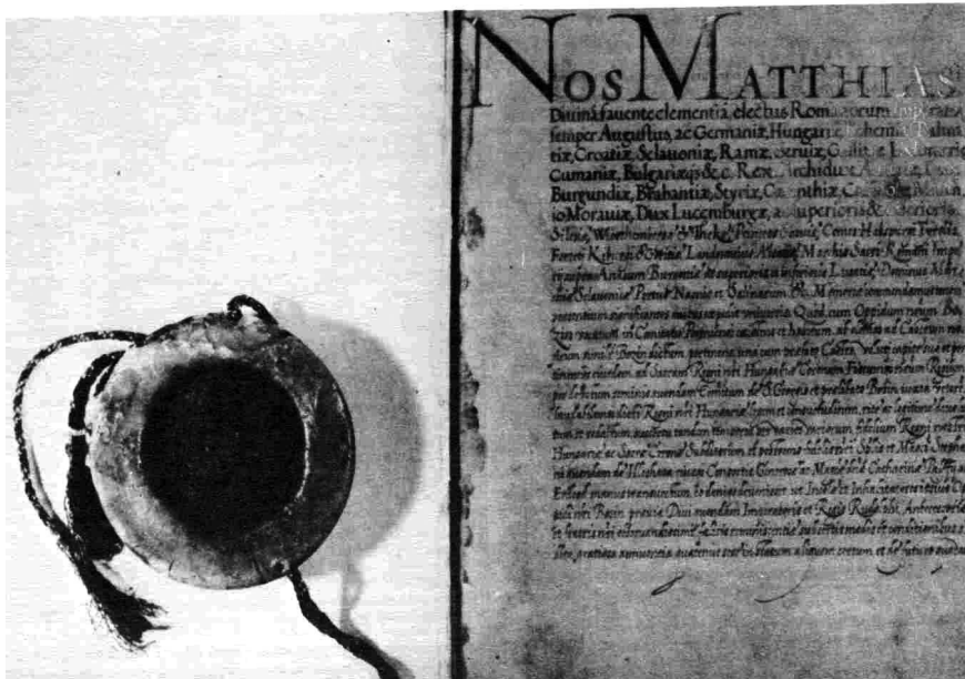
Privilégium kráľa Mateja II. pre slobodné kráľovské mesto Pezinok z roku 1615