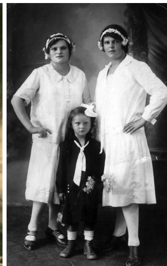
Pamiatka na birbovanie z roku 1923