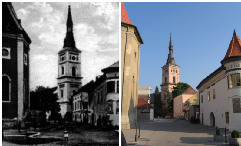
Potočná ulica v roku 1925 a dnes

Roku 1930 - z celkového počtu 6 079 obyvateľov malo 2691 obyvateľov predošlé bydlisko mimo Pezinka.