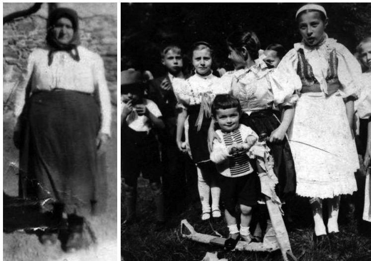
Pracovné oblečenie Pezinčanky[5] a oslava Dňa matiek v roku 1942