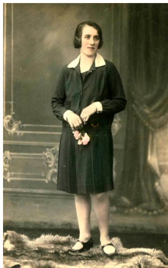
Obyvatelka mesta v polovici 20. rokov 20. storočia