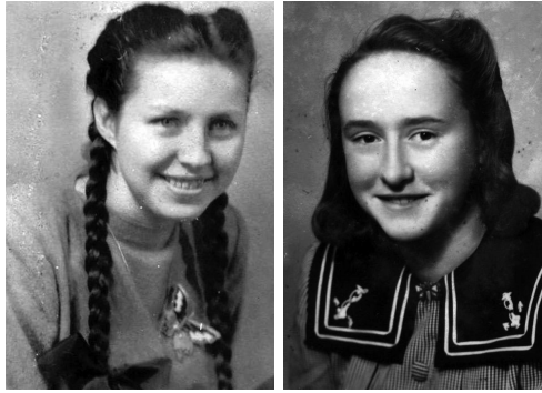
Pezinská krásavica v polovici 40. rokov 20. storočia a Mladá Bratislavčanka evakuovaná do Pezinka