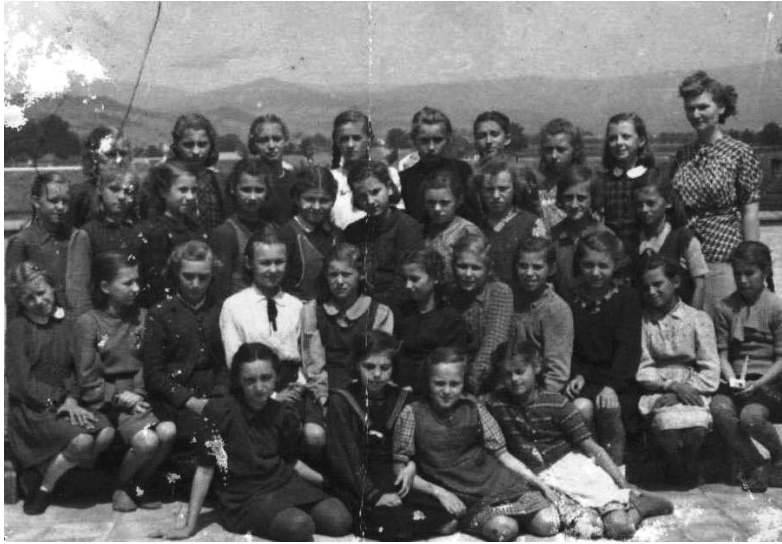
Pezinské školáčky Holubyho ľudovej školy na konci 30. rokov 20. storočia