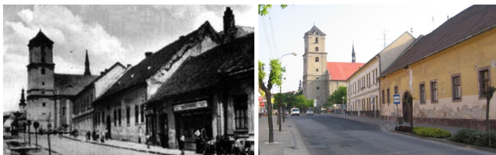
Holubyho ulica v prvej polovici 20. storočia

Roku 1940 - mal Pezinok 7 002 obyvateľov.