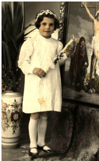
Malá pezinská parádnica na prvom svätom prijímaní v roku 1939

Roku 1940 - mal Pezinok 7 002 obyvateľov.