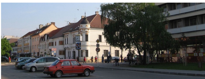
Tá istá ulica dnes