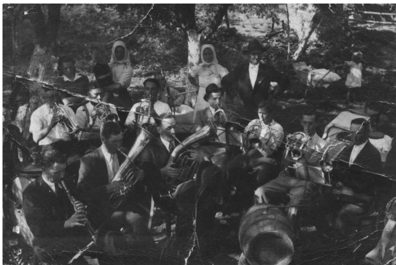
Grinavanka hrá na oslave Dňa matiek v roku 1943