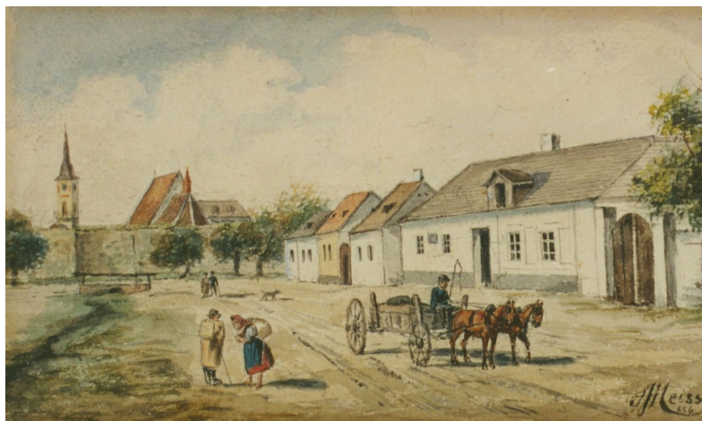
Pezínok v minulosti