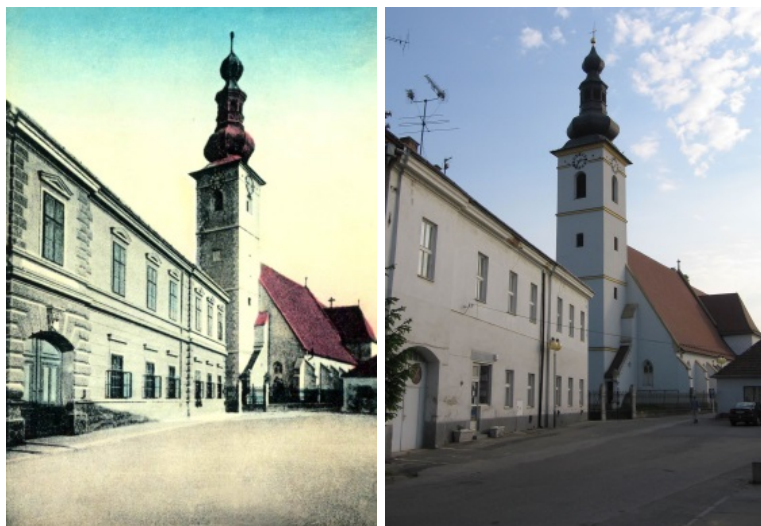
Farská ulica kedysi a dnes

- mládežníckou organizáciou Československej sociálnodemokratickej strany sa stala novozaložená Robotnícka telovýchovná jednota.