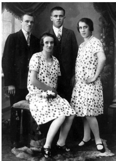
Pezinčania v roku 1933

Roku 1934 - na podporu odbytu vína začalo mesto organizovať vinobranie. Tesne pred vojnou sa táto tradícia prerušila.