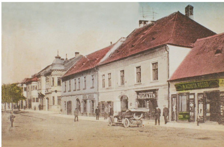
Pezinok v minulosti