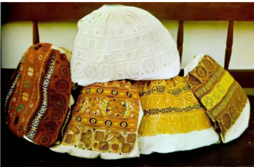
Detva - vyšívané oplecká