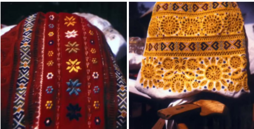
Detva - oplecká