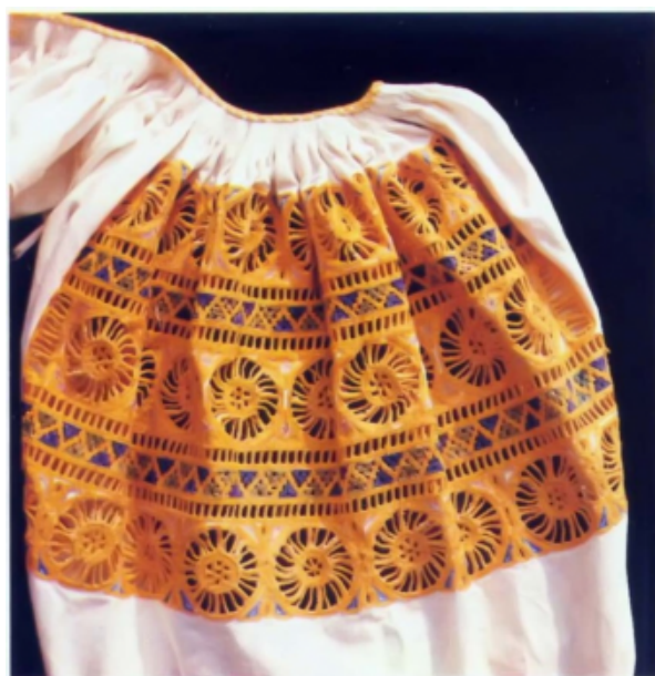
Detva - výšivka na rukávcoch