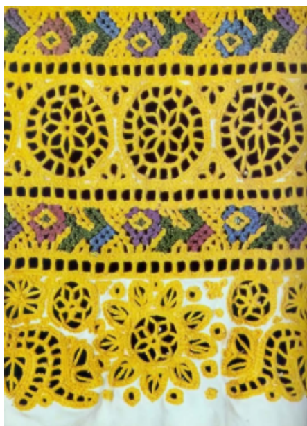
Detva - výšivka na opecku