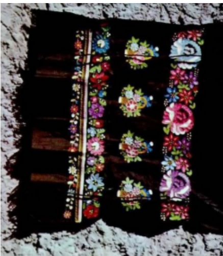
Detva - vyšívaná mužská zástera