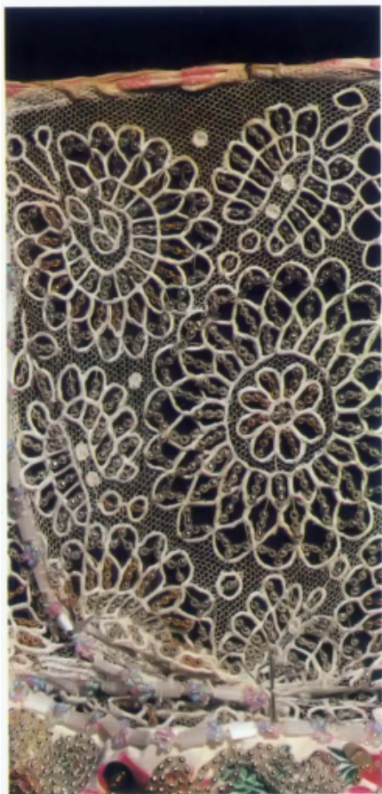
Detva - výšivka na čepci