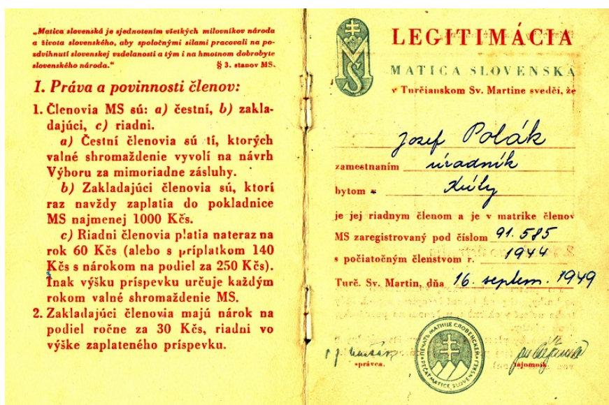
Legitimácia člena Matice slovenskej