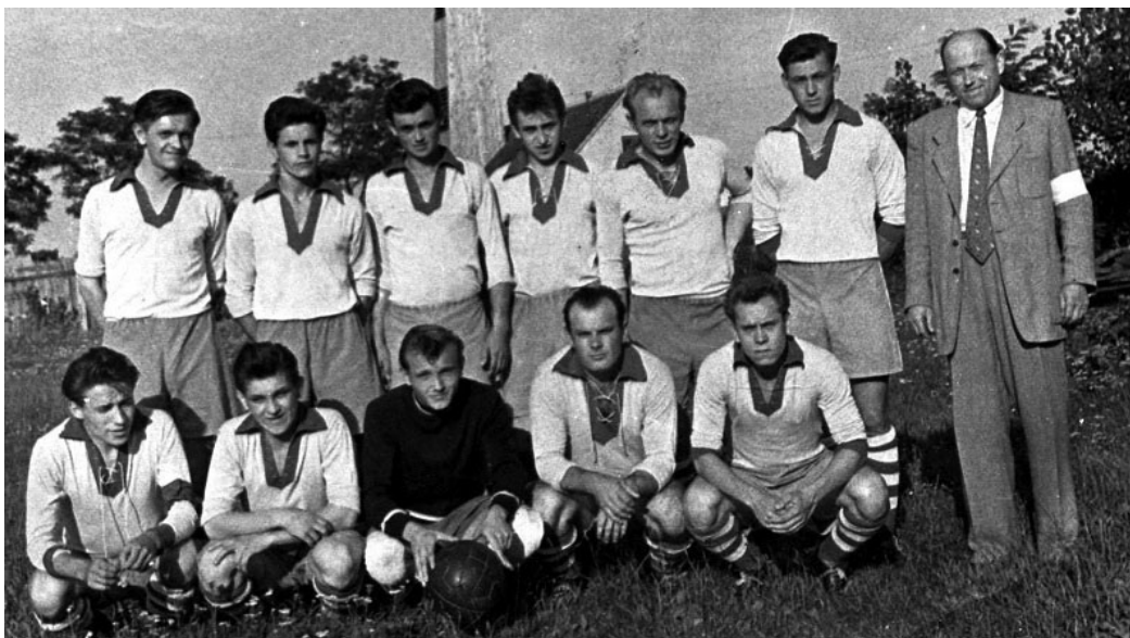
Futbalové mužstvo A-C Kúty v roku 1946