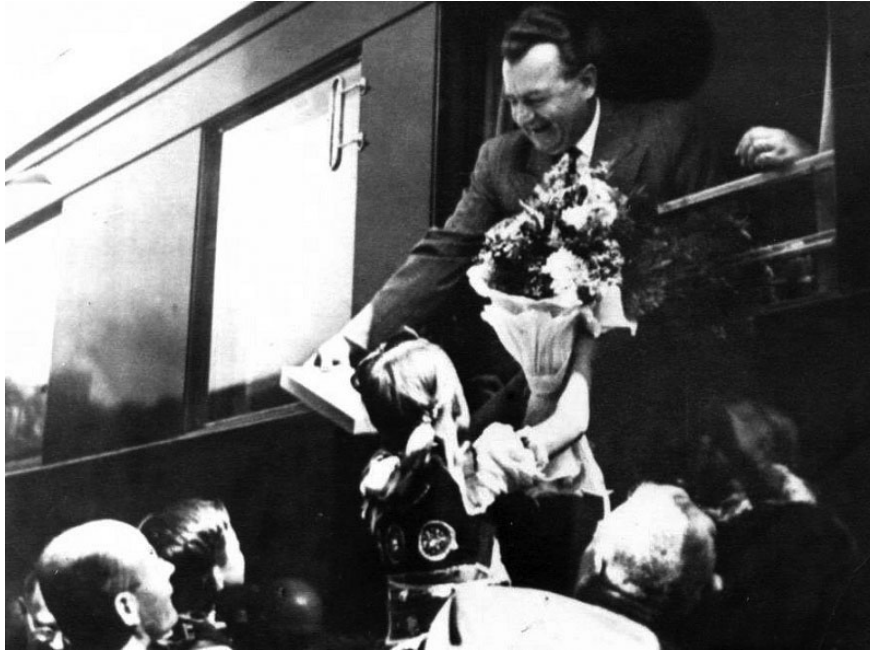
Klement Gottwald na železničnej stanici v Kútoch