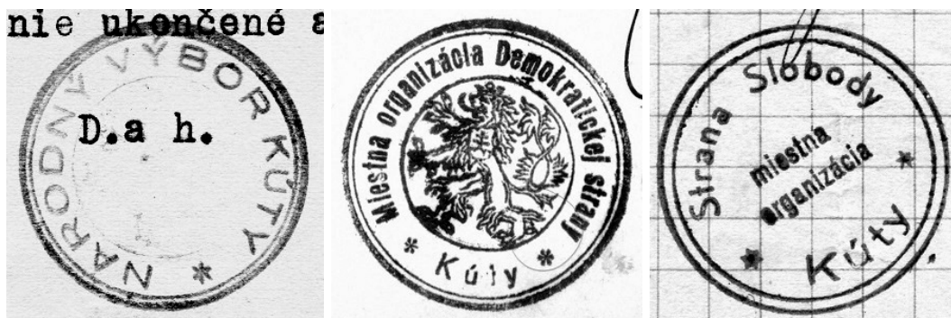
Pečiatka Národného výboru, Demokratickej strany a Strany Slobody

- pôsobili v obci 4 politické strany: Komunistická strana Slovenska, Demokratická strana, Strana Slobody a Strana práce,