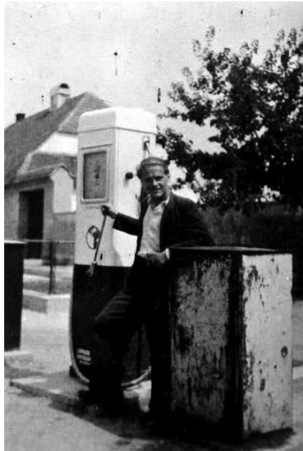
Benzínová pumpa v roku 1948 (stála oproti pekárni na námestí)