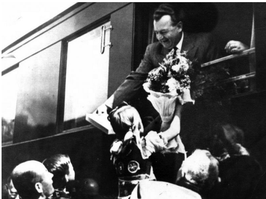
Klement Gottwald na železničnej stanici v Kútoch