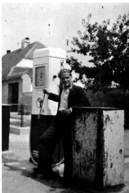
Benzínová pumpa v roku 1948 (stála oproti pekárni na námestí)