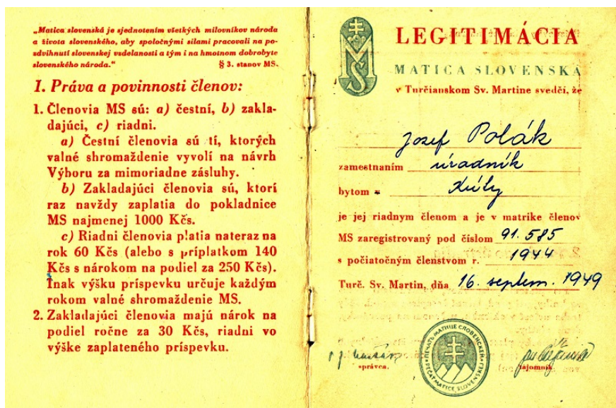
Legitimácia člena Matice slovenskej