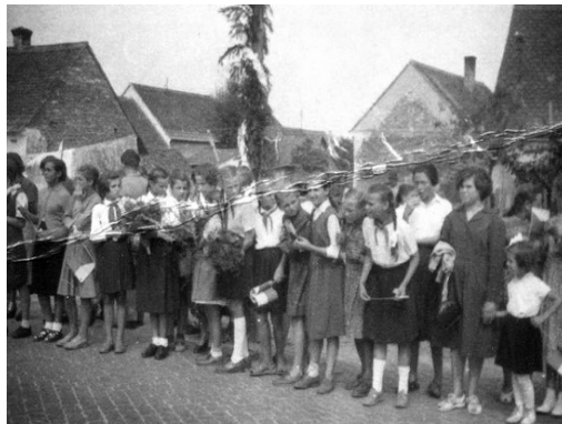
Vítanie Chruščova v Kútoch

- v obci sa uskutočnili voľby. Nedeľné ráno bolo nevšedné. Z "tlampačov" [3] miestneho rozhlasu hrali piesne, ľudia boli sviatočne oblečení, členovia speváckeho súboru Bavlnárskych závodov prišli v krojoch,