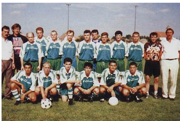
Kútski futbalisti kedysi a dnes