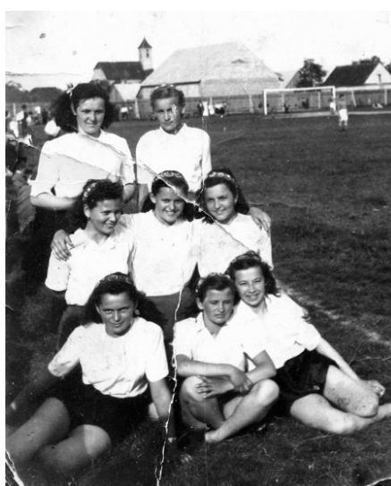
Kútske hasičky v roku 1953