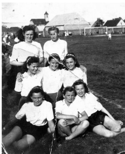
Kútske hasičky v roku 1953