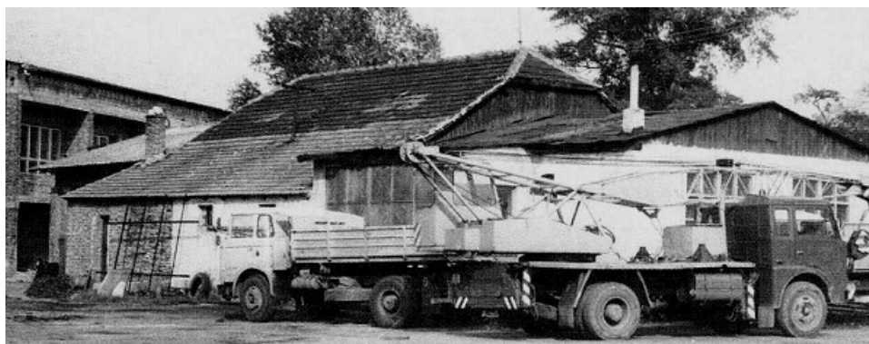
Budova „sogorovne“ v súčasnosti