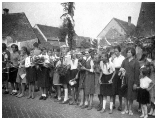
Vítanie Chruščova v Kútoch

- v obci sa uskutočnili voľby. Nedeľné ráno bolo nevšedné. Z "tlampačov" [3] miestneho rozhlasu hrali piesne, ľudia boli sviatočne oblečení, členovia speváckeho súboru Bavlnárskych závodov prišli v krojoch,