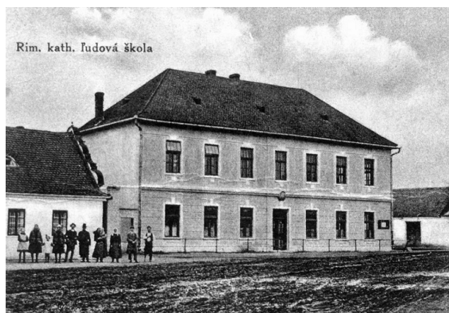
Rímsko-katolícka ľudová škola slúžila ako škola za 1. ČSR a počas Slovenského štátu

- 11. septembra - bol osadený základný kameň novej základnej deväťročnej školy (ZDŠ),