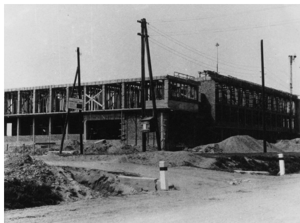
Budovanie novej ZDŠ