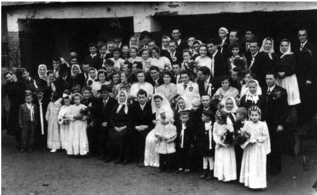
Svadba kúcanov v Kútoch v roku 1955

- sa celé Kúty obliekli do slávnostného rúcha a zišli sa pred pomníkom sovietskych hrdinov, ktorým vzdali vďaku a úctu zato, že pred desiatimi rokmi položili životy za ich slobodu.