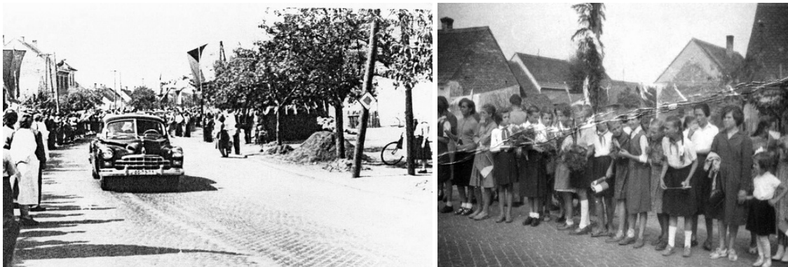
Vítanie Chruščova v Kútoch

- prechádzal cez obec vtedajší ruský prezident Nikita Chruščov,