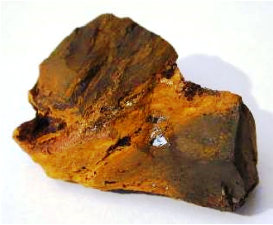
Hydratovaný oxid železitý