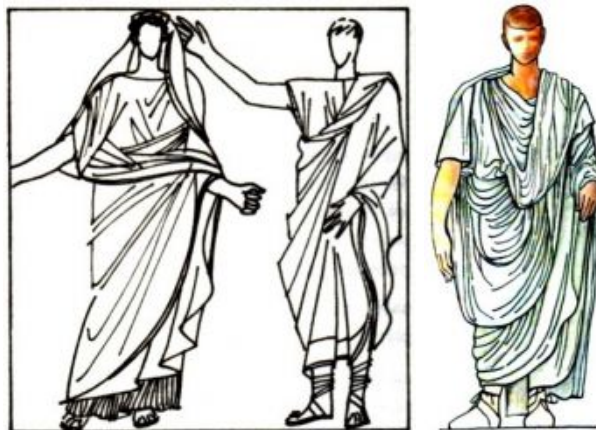
Odev antických Rimanov

Po dobytí Grécka si vyspelá grécka kultúra podmanila praktického ducha Rimanov. Oblečenie helénov dostalo latinské mená a pomerne rýchlo sa udomácnilo. Muži nosili kladený odev, skladajúci sa z tuniky (košeľa preťahovanej cez hlavu), ktorú tvoril jednoduchý vlnený odev tvaru veľkého oválu bez rukávov a tógu (plášť) elipsovitého tvaru, širokú asi 3,5 m a dlhú asi 5,5 m, z bielej vlnenej tkaniny. Senátori ju mali lemovanú purpurovom, cisári ju nosili celú purpurovo-červenú.