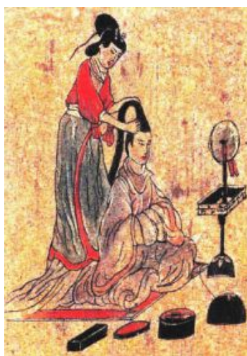
Obliekanie dvornej dámy slúžkou v Japonsku okolo roku 400

Roku 64 p.n.l. - Rimania sa dozvedeli o existencii jemného čínskeho hodvábu, ktorý ich nesmierne očaril. Táto efektná lesklá tkanina sa okamžite stala synonymom prepychu a obľúbeným módnym výstrelkom, takže cisár Tiberius musel striktné zakázať jej dovoz, aby neprišiel o nezanedbateľné príjmy do štátnej pokladnice.