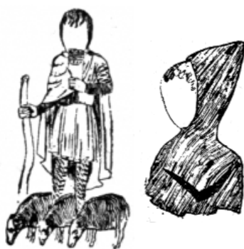
Pastier v roku 1140

Ako materiál sa využíval ľan a vlna, u bohatých vrstiev aj hodváb.