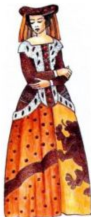
Gotický ženský odev

Nové materiály a kvalitu priniesli križiacke výpravy. Výsledkom štýlového tápania v tej dobe bolo splnutie národných prvkov a vznik nového estetického princípu. Ideál muža zoženštel (muži nosili dlhé, starostlivo upravené vlasy, na hladko si holili tvár...), odev mužov a žien bol veľmi podobný (na rozdiel od ženského nesiahal po zem, ale na kolená). Románske oblečenie sa nahradzovalo gotickým.