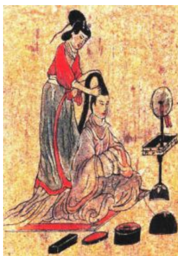
Obliekanie dvornej dámy slúžkou v Japonsku okolo roku 400

Roku 64 p.n.l. - Rimania sa dozvedeli o existencii jemného čínskeho hodvábu, ktorý ich nesmierne očaril. Táto efektná lesklá tkanina sa okamžite stala synonymom prepychu a obľúbeným módnym výstrelkom, takže cisár Tiberius musel striktné zakázať jej dovoz, aby neprišiel o nezanedbateľné príjmy do štátnej pokladnice.