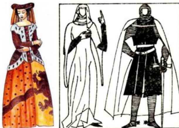
Gotický ženský odev

Nové materiály a kvalitu priniesli križiacke výpravy. Výsledkom štýlového tápania v tej dobe bolo splynutie národných prvkov a vznik nového estetického princípu. Ideál muža zoženštel (muži nosili dlhé, starostlivo upravené vlasy, na hladko si holili tvár...), odev mužov a žien bol veľmi podobný (na rozdiel od ženského nesiahal po zem, ale na kolená). Románske oblečenie sa nahradzovalo gotickým.