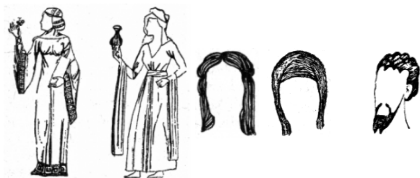
Románske ženské odevy v roku 1000 a 1100