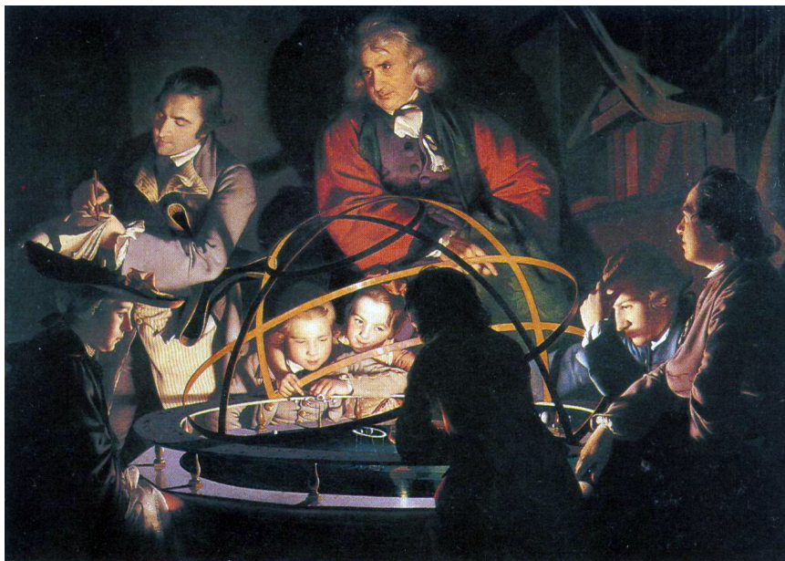
Filozof vyučujúci v planetáriu v 18. storočí

Novoveká filozofia 17. storočia - sa sústreďovala na gnozeologické a metodologické otázky [7] . V tomto období sa riešil spor empirizmu a racionalizmu a objavili sa hlbšie úvahy o postavení a slobode človeka ako občana . K predstaviteľom tohto obdobia patrili: Francis Bacon, Thomas Hobbes, John Locke, George Berkeley, David Hume, Charles-Louis Montesquieu a Slovak Ján Bayer. Zakladateľom novovekého racionalizmu bol René Descartes, jeho pokračovateľom sa stal Baruch Spinoza.