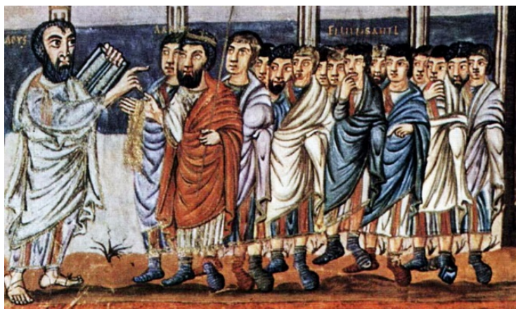
Aj takto mohol vyzeráť výber špiónov

Približne roku 1300 p.n.l. - stál Mojžiš na ceste do zaslúbenej zeme, ktorú mu odporúčal Hospodin, so svojím ľudom v púšti Fáran. Poslúchol hlas boží a podľa jeho návodu zostavil prvú vyzvedačskú skupinu. Do Kanaanu poslal dvanásť vybraných vyzvedačov. Mali zistiť, ako to tam vyzerá a či si môže trúfať s uťahanými Židmi na tamajších vojakov. Každý špión šiel na vlastnú päsť. Tak prezieravý Mojžiš docielil, že správy nemohli od seba odpisovať, ani sa na nich nemohli dohovoriť a on ich mohol neskoršie porovnávať . Táto organizácia vyzvedačov mala ešte ďalšiu výhodu, keby v Kanaane niektorého vyzvedača chytili, správy by boli doniesli ešte ostatní.