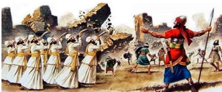
Bitka o Jericho

V čase bitky o Jericho - medzi vyzvedačmi si vtedy veľmi dobre splnil úlohu Ozeáš, syn Nun. Mojžiš mu dal neskoršie krycie meno Jozua, a s týmto menom vošiel do dejín ako šéf ďalšej špiónážnej operácie, o ktorej sa v Biblii hovorí. Titulnú rolu v tomto príbehu zohrala prastará mať kráľa Dávida, obyvateľka mesta Jericha, Rahab, jedna z prvých vyzvedačiek na svete.