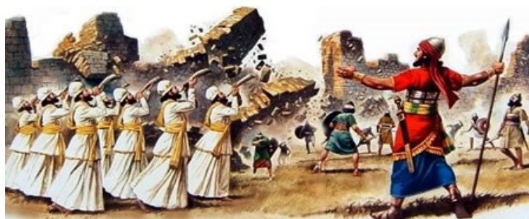
Bitka o Jericho

V čase bitky o Jericho - medzi vyzvedačmi si vtedy veľmi dobre splnil úlohu Ozeáš, syn Nun. Mojžiš mu dal neskoršie krycie meno Jozua, a s týmto menom vošiel do dejín ako šéf ďalšej špiónážnej operácie, o ktorej sa v Biblii hovorí. Titulnú rolu v tomto príbehu zohrala prastará mať kráľa Dávida, obyvateľka mesta Jericha, Rahab, jedna z prvých vyzvedačiek na svete.