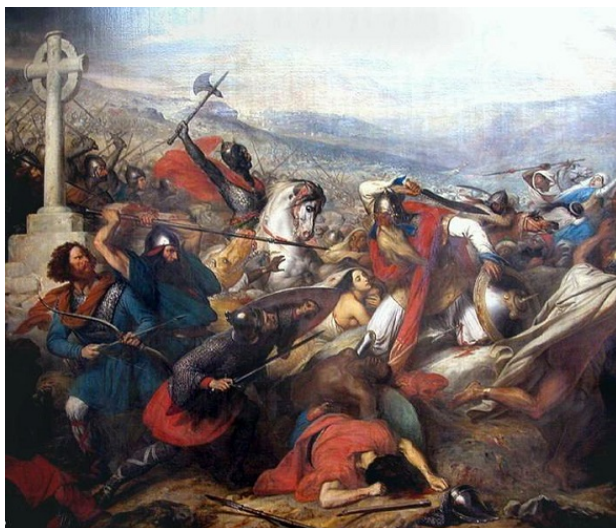
Bitka pri Poitiers

V 12.-13. storočí - mongolský dobyvateľ Džingischán (1155-1227) posielal na nepriateľské územie pár dní pred tým, ako prepadol mesto alebo strategicky dôležitú pozíciu, vyzvedačský predvoj, podomových obchodníkov alebo svojich ľudí v role utečencov. Mali jedinou úlohu: šikovnými rečami podhadzovali nepriateľovi úplne klamnú predstavu o Džingischánových strategických úmysloch, o sile jeho vojska a o jeho možnostiach. Aj táto metóda sa udržala dodnes.