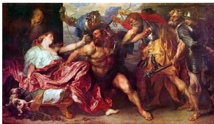
Dalila, Samson a jeho zajatie Filištíncami

Dalila je zasa prvá žena v špionážnych dejinách, ktorá do nebezpečnej hry okrem odvahy vložila aj dievčenský pôvab . Tak založila nové a po celé storočia dobre platené odvetvie druhého najstaršieho remesla. Ako väčšina jej novodobých kolegýň, ani ona sa však nedočkala, aby si mohla v pokoji a ústraní užiť ťažko zarobené peniaze. Bola totiž medzi tými troma tisíckami pozvaných hostí, čo zahynuli pri slávnosti v troskách paláca, na ktorom podrazil stĺpy rozzúrený silák Samson. Smutným paradoxom je, že to bola práve Dalila, ktorá predstierajúc lásku, vyšpehovala zdroj Samsonovej sily, a po jeho uväznení vyinkasovala za to od Filištíncov jedenásť stovák strieborných.