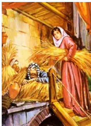
Rahab a špióni

Večer potom vyšla na strechu a obidvoch vyzvedačov spustila na povraze za hradby. Židovským vyzvedačom však neposkytla vzácne informácie zadarmo. Myslela na zadné kolesá, a vymohla si od nich sľub, že ak Jozua zvíťazí nad Jerichom a začne ho ničiť a plieniť, ju aj s rodinou uchráni. Vyzvedači sľúbili, a šéf Jozua dohodu splnil. Keď Židia dobyli mesto, dovolili pani Rahab pokojne odísť s batožinou, početným príbuzenstvom a dobytkom ešte prv ako dom spálili. Rahab zachránila seba a rodinu a neprišla ani o majetok. To bola asi vôbec prvá vyzvedačská odmena . Možno z vďačnosti, možno z vypočítavosti, sa potom Rahab vydala za jedného z vyzvedačov.