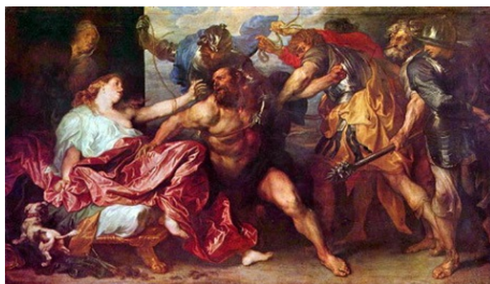
Dalila, Samson a jeho zajatie Filištíncami

Dalila je zasa prvá žena v špionážnych dejinách, ktorá do nebezpečnej hry okrem odvahy vložila aj dievčenský pôvab . Tak založila nové a po celé storočia dobre platené odvetvie druhého najstaršieho remesla. Ako väčšina jej novodobých kolegýň, ani ona sa však nedočkala, aby si mohla v pokoji a ústraní užiť ťažko zarobené peniaze. Bola totiž medzi tými troma tisíckami pozvaných hostí, čo zahynuli pri slávnosti v troskách paláca, na ktorom podrazil stĺpy rozzúrený silák Samson. Smutným paradoxom je, že to bola práve Dalila, ktorá predstierajúc lásku, vyšpehovala zdroj Samsonovej sily, a po jeho uväznení vyinkasovala za to od Filištíncov jedenásť stovák strieborných.