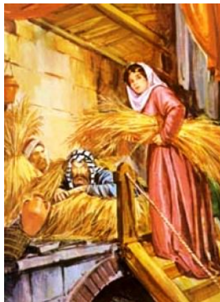
Rahab a špióni

Večer potom vyšla na strechu a obidvoch vyzvedačov spustila na povraze za hradby. Židovským vyzvedačom však neposkytla vzácne informácie zadarmo. Myslela na zadné kolesá, a vymohla si od nich sľub, že ak Jozua zvíťazí nad Jerichom a začne ho ničiť a plieniť, ju aj s rodinou uchráni. Vyzvedači sľúbili, a šéf Jozua dohodu splnil. Keď Židia dobyli mesto, dovolili pani Rahab pokojne odísť s batožinou, početným príbuzenstvom a dobytkom ešte prv ako dom spálili. Rahab zachránila seba a rodinu a neprišla ani o majetok. To bola asi vôbec prvá vyzvedačská odmena . Možno z vďačnosti, možno z vypočítavosti, sa potom Rahab vydala za jedného z vyzvedačov.