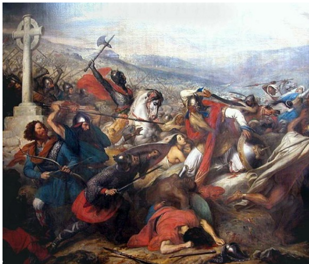
Bitka pri Poitiers

V 12.-13. storočí - mongolský dobyvateľ Džingischán (1155-1227) posielal na nepriateľské územie pár dní pred tým, ako prepadol mesto alebo strategicky dôležitú pozíciu, vyzvedačský predvoj, podomových obchodníkov alebo svojich ľudí v role utečencov. Mali jedinou úlohu: šikovnými rečami podhadzovali nepriateľovi úplne klamnú predstavu o Džingischánových strategických úmysloch, o sile jeho vojska a o jeho možnostiach. Aj táto metóda sa udržala dodnes.