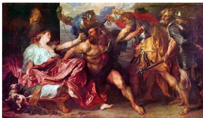
Dalila, Samson a jeho zajatie Filištíncami

Dalila je zasa prvá žena v špionážnych dejinách, ktorá do nebezpečnej hry okrem odvahy vložila aj dievčenský pôvab . Tak založila nové a po celé storočia dobre platené odvetvie druhého najstaršieho remesla. Ako väčšina jej novodobých kolegýň, ani ona sa však nedočkala, aby si mohla v pokoji a ústraní užiť ťažko zarobené peniaze. Bola totiž medzi tými troma tisíckami pozvaných hostí, čo zahynuli pri slávnosti v troskách paláca, na ktorom podrazil stĺpy rozzúrený silák Samson. Smutným paradoxom je, že to bola práve Dalila, ktorá predstierajúc lásku, vyšpehovala zdroj Samsonovej sily, a po jeho uväznení vyinkasovala za to od Filištíncov jedenásť stovák strieborných.