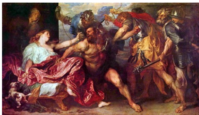
Dalila, Samson a jeho zajatie Filištíncami

Dalila je zasa prvá žena v špionážnych dejinách, ktorá do nebezpečnej hry okrem odvahy vložila aj dievčenský pôvab . Tak založila nové a po celé storočia dobre platené odvetvie druhého najstaršieho remesla. Ako väčšina jej novodobých kolegýň, ani ona sa však nedočkala, aby si mohla v pokoji a ústraní užiť ťažko zarobené peniaze. Bola totiž medzi tými troma tisíckami pozvaných hostí, čo zahynuli pri slávnosti v troskách paláca, na ktorom podrazil stĺpy rozzúrený silák Samson. Smutným paradoxom je, že to bola práve Dalila, ktorá predstierajúc lásku, vyšpehovala zdroj Samsonovej sily, a po jeho uväznení vyinkasovala za to od Filištíncov jedenásť stovák strieborných.