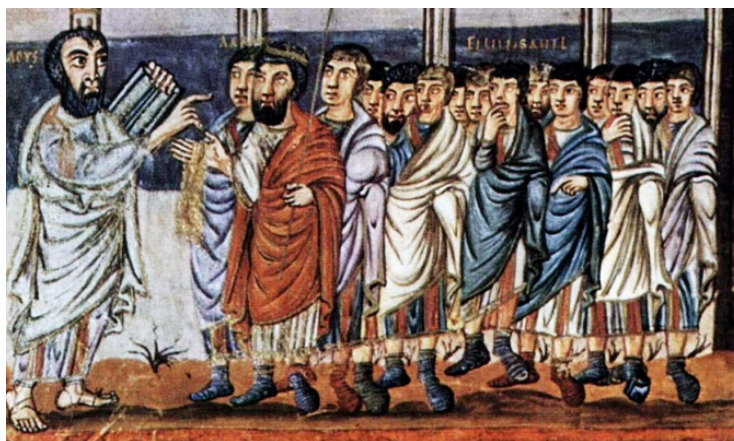
Aj takto mohol vyzeráť výber špiónov

Približne roku 1300 p.n.l. - stál Mojžiš na ceste do zaslúbenej zeme, ktorú mu odporúčal Hospodin, so svojím ľudom v púšti Fáran. Poslúchol hlas boží a podľa jeho návodu zostavil prvú vyzvedačskú skupinu. Do Kanaanu poslal dvanásť vybraných vyzvedačov. Mali zistiť, ako to tam vyzerá a či si môže trúfať s uťahanými Židmi na tamajších vojakov. Každý špión šiel na vlastnú päsť. Tak prezieravý Mojžiš docielil, že správy nemohli od seba odpisovať, ani sa na nich nemohli dohovoriť a on ich mohol neskoršie porovnávať . Táto organizácia vyzvedačov mala ešte ďalšiu výhodu, keby v Kanaane niektorého vyzvedača chytili, správy by boli doniesli ešte ostatní.