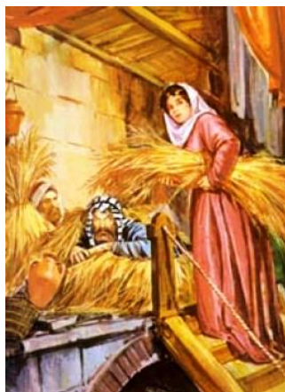
Rahab a špióni

Večer potom vyšla na strechu a obidvoch vyzvedačov spustila na povraze za hradby. Židovským vyzvedačom však neposkytla vzácne informácie zadarmo. Myslela na zadné kolesá, a vymohla si od nich sľub, že ak Jozua zvíťazí nad Jerichom a začne ho ničiť a plieniť, ju aj s rodinou uchráni. Vyzvedači sľúbili, a šéf Jozua dohodu splnil. Keď Židia dobyli mesto, dovolili pani Rahab pokojne odísť s batožinou, početným príbuzenstvom a dobytkom ešte prv ako dom spálili. Rahab zachránila seba a rodinu a neprišla ani o majetok. To bola asi vôbec prvá vyzvedačská odmena . Možno z vďačnosti, možno z vypočítavosti, sa potom Rahab vydala za jedného z vyzvedačov.