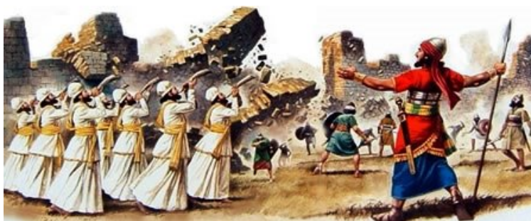
Bitka o Jericho

V čase bitky o Jericho - medzi vyzvedačmi si vtedy veľmi dobre splnil úlohu Ozeáš, syn Nun. Mojžiš mu dal neskoršie krycie meno Jozua, a s týmto menom vošiel do dejín ako šéf ďalšej špiónážnej operácie, o ktorej sa v Biblii hovorí. Titulnú rolu v tomto príbehu zohrala prastará mať kráľa Dávida, obyvateľka mesta Jericha, Rahab, jedna z prvých vyzvedačiek na svete.