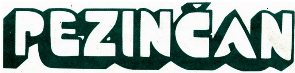
Hlavička časopisu Pezinčan z roku 2005