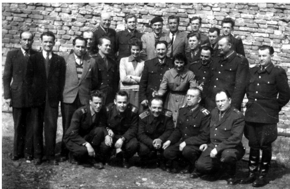
Zamestnanci Okresného veliteľstva ZNB v Pezinku v roku 1956

Roku 1959, 26.-27. septembra - sa v Pezinku konalo prvé tradičné malokarpatské vinobranie. Na výstave vín bolo možné ochutnať 250 druhov vín. Súčasne bolo otvorené i malé múzeum Jána Kupeckého.