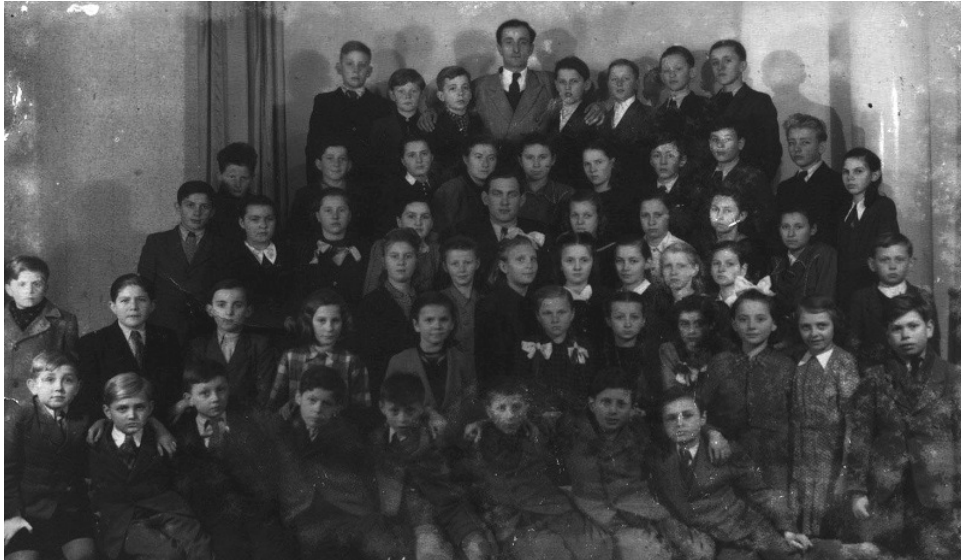
Dorast divadelného dramatického krúžku Poverello v roku 1947