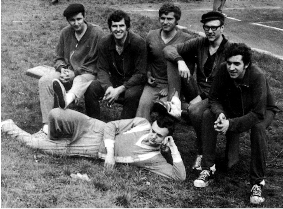
Pezinskí volejbalisti v roku 1971

Roku 1970 - mal Pezinok 12 123 obyvateľov.