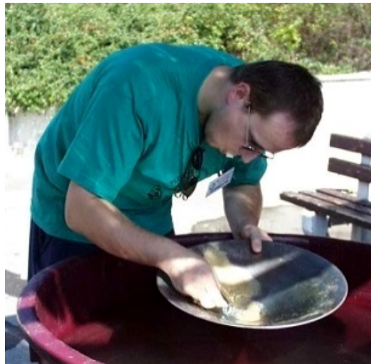
Ryžovanie zlata ako súčasť Pezinského Permoníka sa prvýkrát uskutočnilo v roku 1999

Roku 1997 - bola zavedená tradícia, že primátor mesta prijíma a odceňuje najúspešnejších športovcov roka.