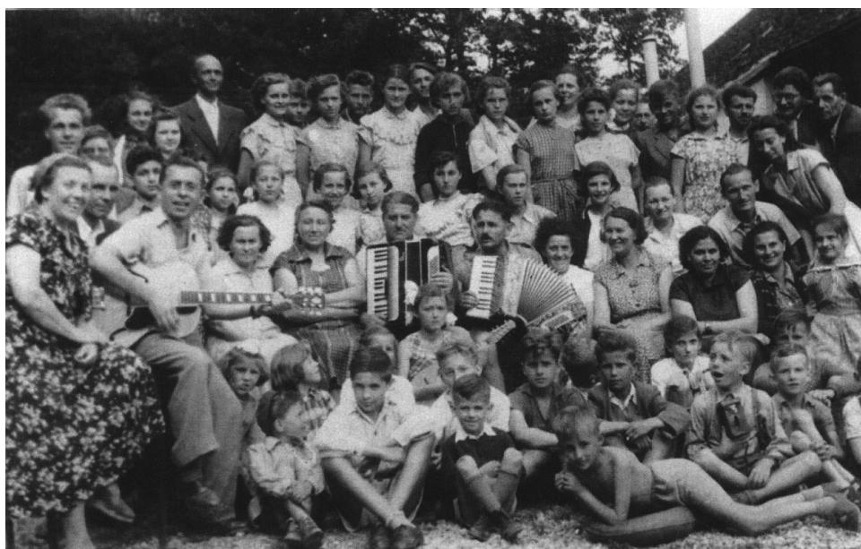
Účastníci výletu Hudobnej školy Pezinok na konci školského roka 1951/1952

Roku 1953 - bola v Pezinku zriadená okresná knižnica. Dovtedy bola v Pezinku iba obecná knižnica, ktorá prechodom frontu utrpela značné straty.