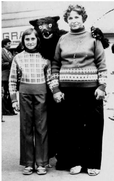
Jedna z atrakcií vinobrania začiatkom 70. rokov

Roku 1970 - mal Pezinok 12 123 obyvateľov.