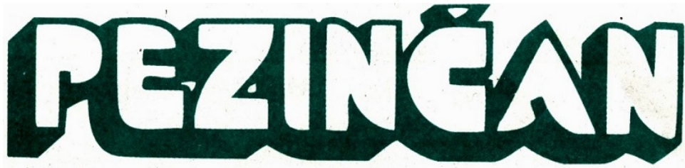
Hlavička časopisu Pezinčan z roku 2005