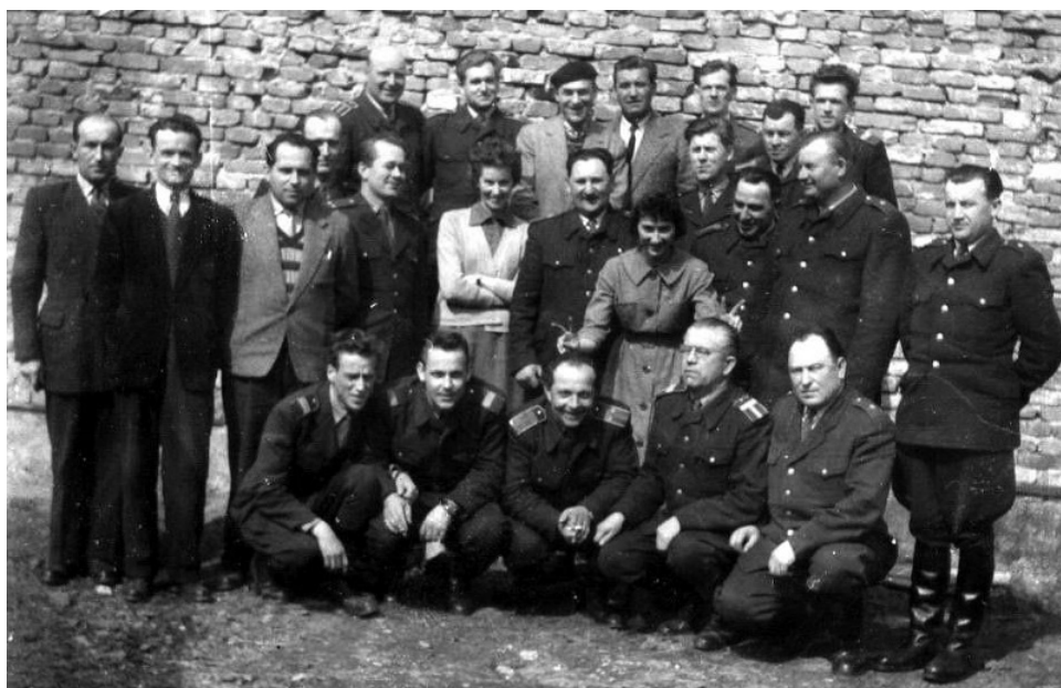
Zamestnanci Okresného veliteľstva ZNB v Pezinku v roku 1956

Roku 1959, 26.-27. septembra - sa v Pezinku konalo prvé tradičné malokarpatské vinobranie. Na výstave vín bolo možné ochutnať 250 druhov vín. Súčasne bolo otvorené i malé múzeum Jána Kupeckého.