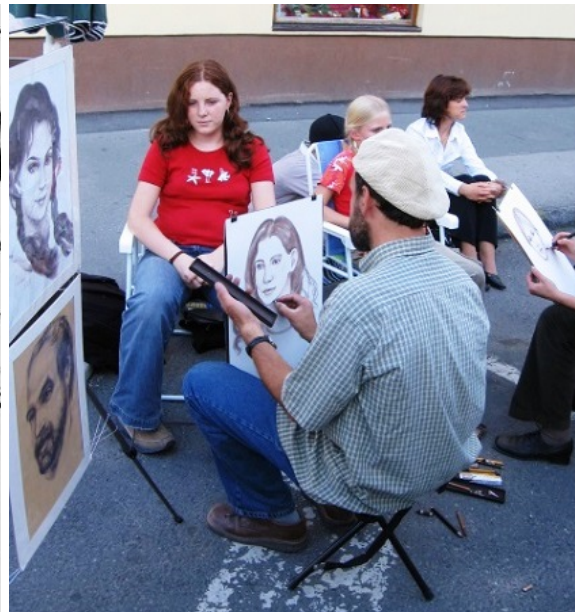
Jedna z atrakcií vinobrania konanom v roku 2005

Roku 1974 - bol na dovtedy „čisto“ HŠ otvorený aj odbor literárno-dramatický.