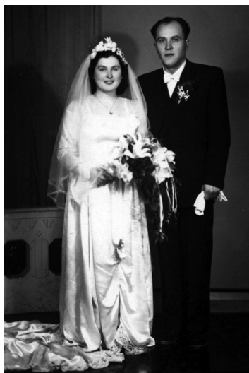
Svadba Pezinčanov v roku 1952