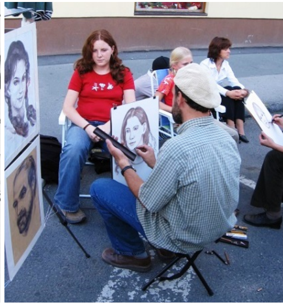
Jedna z atrakcií vinobrania konanom v roku 2005

Roku 1974 - bol na dovtedy „čisto“ HŠ otvorený aj odbor literárno-dramatický.