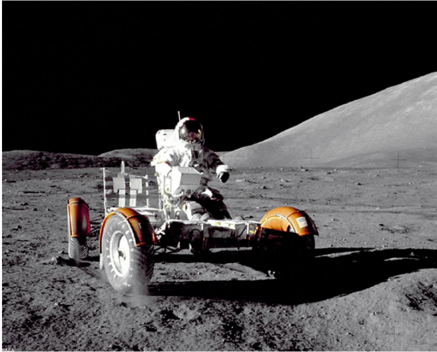
Cernan na Mesiaci

Eugene Cernan po návrate pracoval v kozmonautickom stredisku v Houstone vo funkcii riaditeľa Elektrotechnického výskumného ústavu pre potreby kozmických letov, neskôr ako zástupca riaditeľa programu Apollo-Sojuz, v ktorom zodpovedal za prípravu kozmonautov.