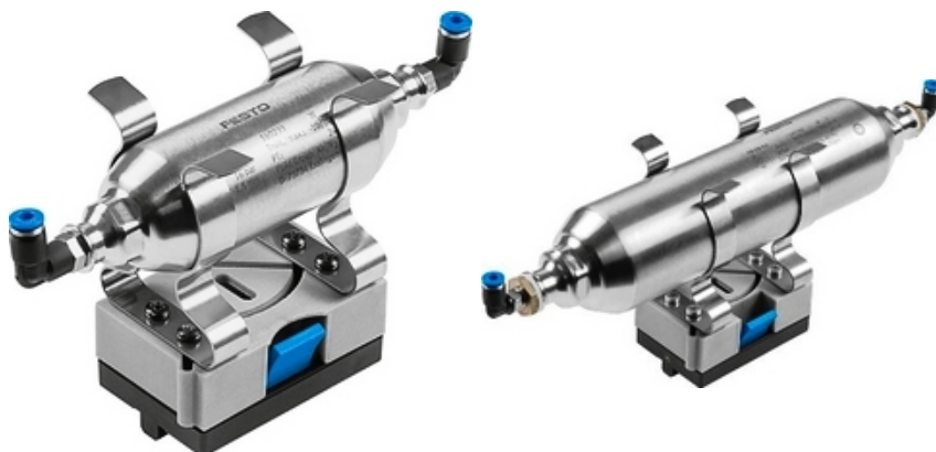
Zásobníky spoločnosti FESTO

Jednotka, ktorej účelom je zabezpečiť požadovanú množstvo vzduchu.