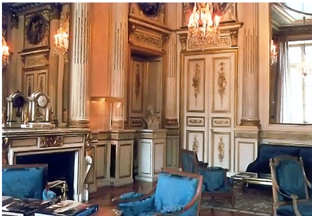
Prijímací salón klenotníctva Chaumet

Jedno z najznámejších svetových klenotníctiev.