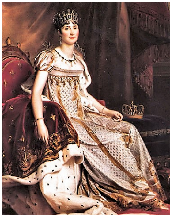
Josephine, Napoleonova manželka, s klenotmi Chaumet