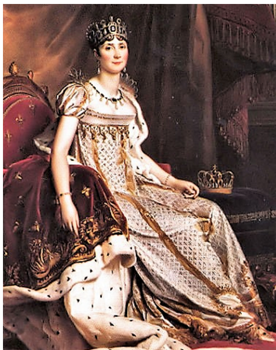
Josephine, Napoleonova manželka, s klenotmi Chaumet