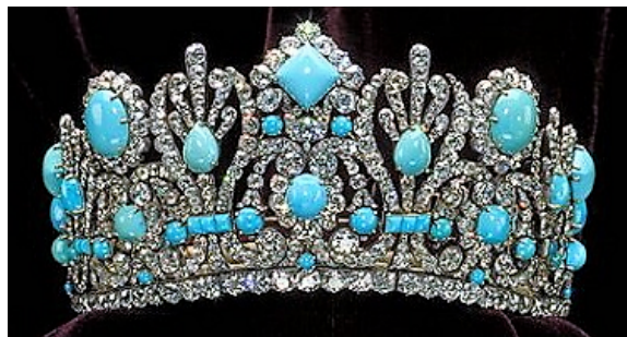
Ďalšie šperky spoločnosti Chaumet