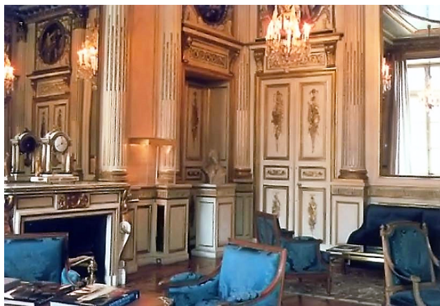
Prijímací salón klenotníctva Chaumet

Jedno z najznámejších svetových klenotníctiev.