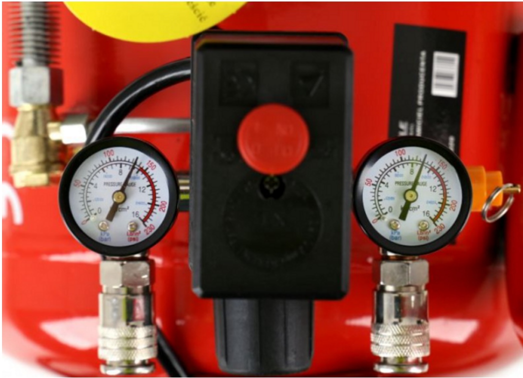
Manometre umiestnené na kompresore