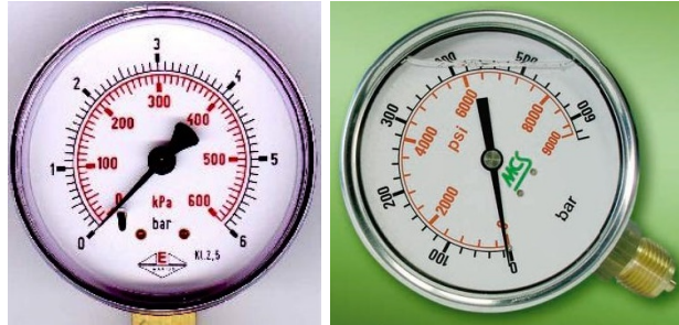
Manometre na meranie tlaku plynu a kvapaliny