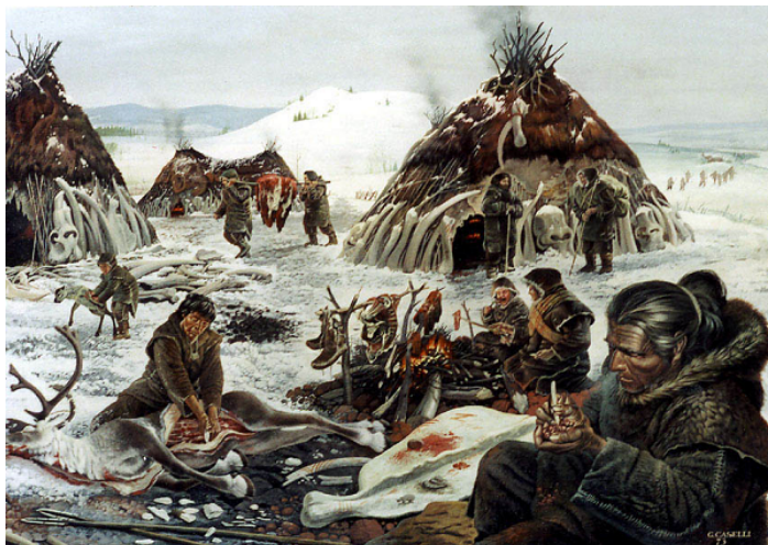
Lov mamutov a život v dobe ľadovej

Pred 40 000-8 000 rokmi - ľudia dokázali založiť oheň s pomocou lukového vrtáka, dľabaním vyrobiť primitívne člny, zdokonalili zbrane, začali používať luk, dokázali zhotoviť nástroje z viacerých súčastí, zhotoviť odevy z koží, ktoré zošívali šľachami, pripravovali pečené a varené jedlá, začali pliesť košíky, vzniklo hrnčiarstvo. Naši predkovia začali svoje príbytky osvetľovať jednoduchými faklami a kahancami a taktiež začali vyrábať i prvé ozdoby.