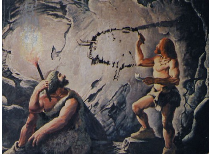
Z obdobia pred 17 000 rokmi pochádzajú aj známe maľby cro-magnonského človeka nachádzajúce sa v jaskyni v Lascaux v južnom Francúzsku.