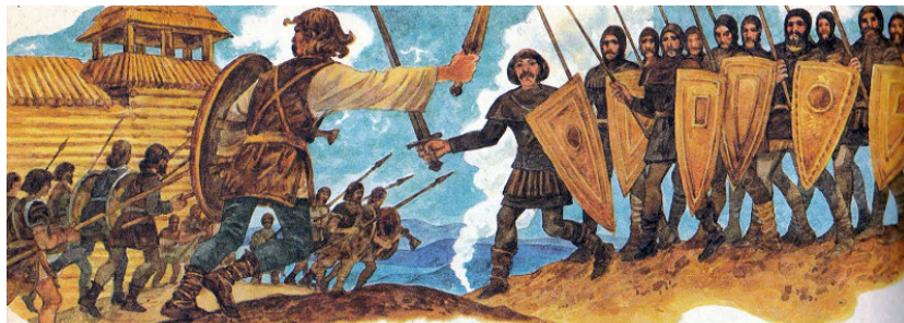
Bitka pri Vogastisburgu

Samova ríša sa rozprestierala na juhozápadnom Slovensku, južnej Morave a príľahlej časti Rakúska, v priebehu jej trvania sa k nej pripojili i srbskí a korutánski Slovania. Jej centrum, ktoré sa dodnes nepodarilo presne zistiť, ležalo v priestore Mikulčice na Morave – Viedeň – Bratislava. Po smrti Sama v roku 658 sa Samova ríša rozpadla.