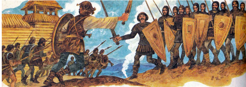
Bitka pri Vogastisburgu

Samova ríša sa rozprestierala na juhozápadnom Slovensku, južnej Morave a príľahlej časti Rakúska, v priebehu jej trvania sa k nej pripojili i srbskí a korutánski Slovania. Jej centrum, ktoré sa dodnes nepodarilo presne zistiť, ležalo v priestore Mikulčice na Morave – Viedeň – Bratislava. Po smrti Sama v roku 658 sa Samova ríša rozpadla.