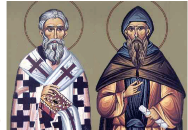
Konštantín a Metod