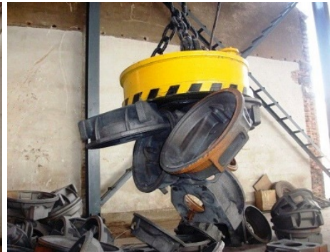
Využitie elektromagnetu v priemysle