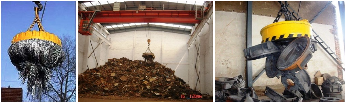
Využitie elektromagnetu v priemysle