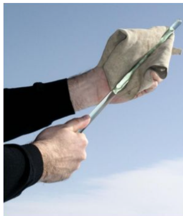
Ak sklo trieme textilom, sklo stratí elektróny a textil ich získa