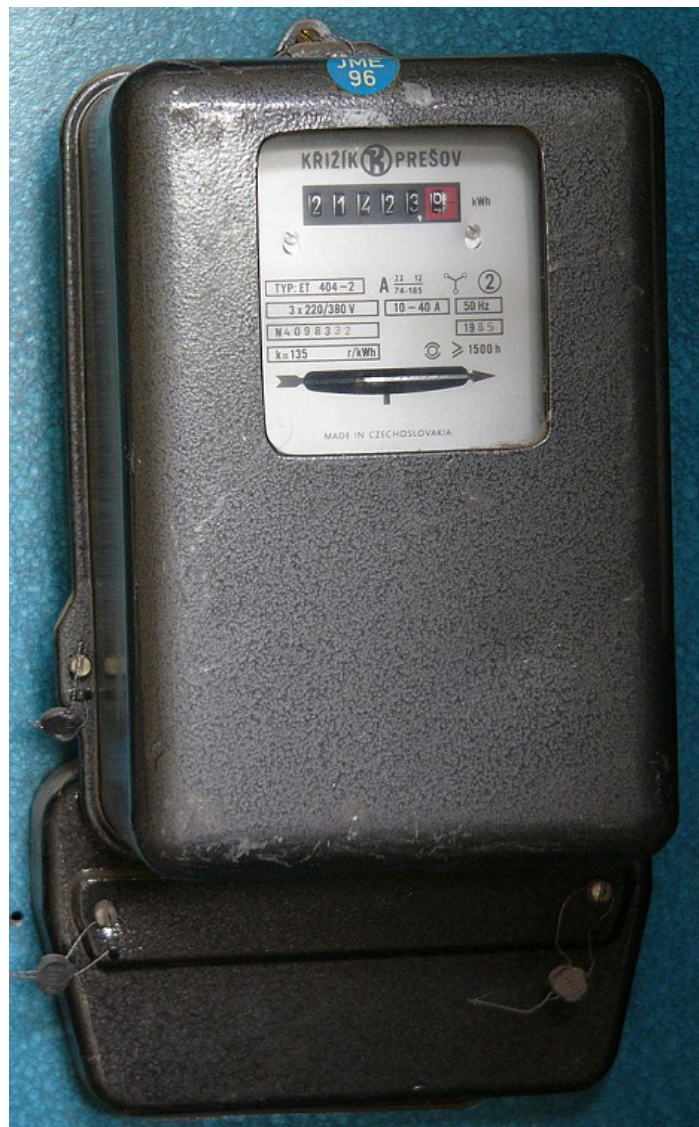
Klasický trojfázový analógový elektromer typu Krížik ET 404, ktorý sa vyrábala v Prešove od roku 1974