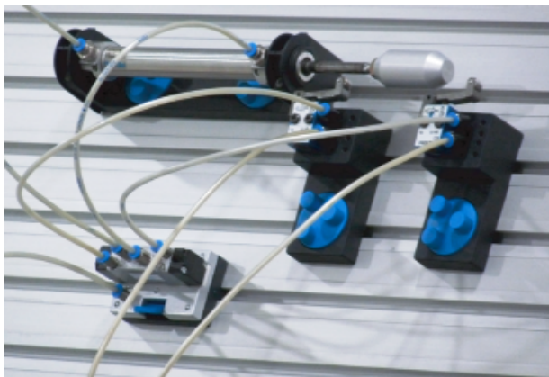
Použitie mechanických koncových spínačov