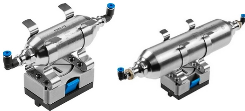
"Školské" zásobníky spoločnosti FESTO