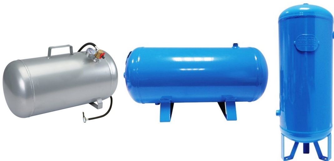
Fotografie ležatého a stojateho vzdušníka

Stlačený vzduch v zásobníku, sa vďaka jeho veľkej ploche, ochladzuje. Vzniká tak kondenzát , ktorý sa vypúšťa výpustným ventilom.