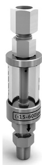
Fotografia filtra pevných častíc

Nahromadený kondenzát je potrebné po prekročení maximálnej hranice odstrániť inak sa opäť pripojí k prúdu vzduchu.