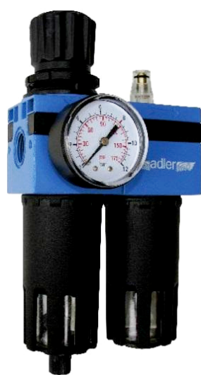
Filter s redukčným ventilom a primastovacou jednotkou