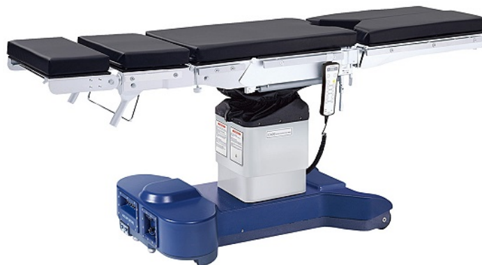
Operačný stôl = využitie dráhového prevodu v lekárskej praxi