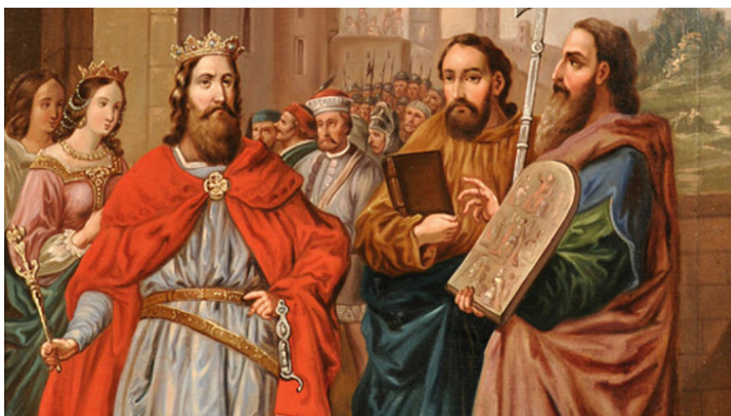
Konštantín a Metod

Hlaholika , História Slovenska (Dejiny Slovenska) - 04.časť – Veľkomoravská ríša (Veľká Morava)