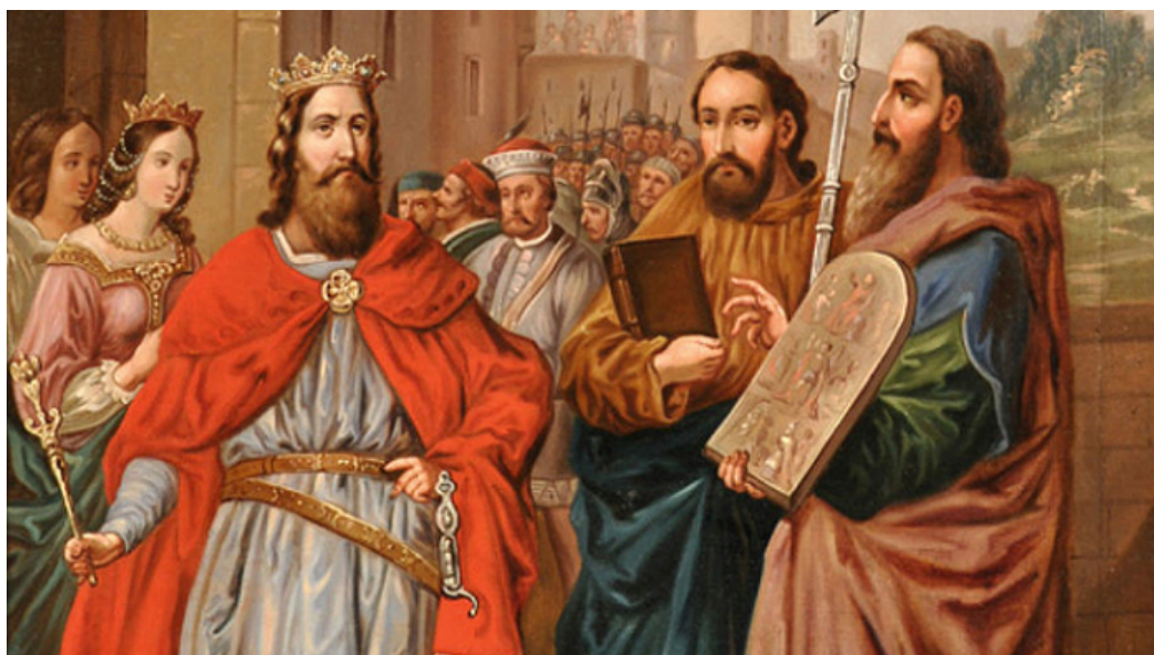
Konštantín a Metod

Hlaholika , História Slovenska (Dejiny Slovenska) - 04.časť – Veľkomoravská ríša (Veľká Morava)