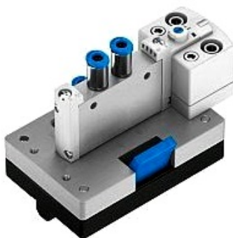
Fotografia 5/2-cestného e-pneumatického ventilu ovládaného z jednej strany pružinou