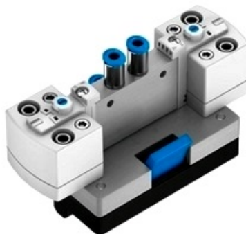
Fotografia 5/2-cestného e-pneumatického ventilu ovládaného z oboch strán elektricky

Ak sa neovláda žiaden z obidvoch elektromagnetov, zotrvá piest v poslednej prijatej polohe. Toto tvrdenie platí tiež vtedy, ak sa obidva elektromagnety súčasne pripoja k prúdu a tým pôsobia proti sebe rovnakou silou.