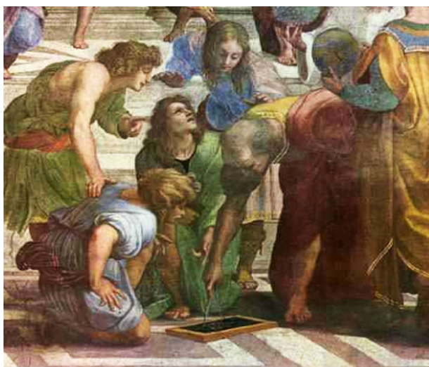
Euklides a deti pri vyučovaní geometrie

Už do starovekého Egypta a Grécka – siahajú počiatky rysovania, keď prax nútila človeka zobrazovať priestorové útvary na rovinu.