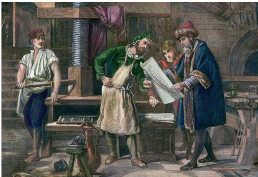
Takto to vyzeralo v Gutenbergovej tlačiarni

Tlačiť sa pokúsil už pred rokom 1440. O Gutenbergovi a jeho vynáleze nie sú žiadne reálne dokumenty, a tak rok kedy vynašiel prvý tlačiarsky stroj môžeme odhadovať na dobu od roku 1436 až 1443. Dôležitým podnetom k jeho vynálezu boli hospodárske záujmy: Gutenberg bol podnikavý, všestranne nadaný človek, so zmyslom pre umelecké remeslá. Svojim vynálezom vytvára typografický obrazec európskej tlačenej knihy. Podstatou jeho vynálezu nie je kníhtlač ako taká (tá bola vynájdená už pred ním) ale tzv. lejací prístroj. Gutenberg bol tvorcom písma a typografickej úpravy, sadzačom, ale aj tlačiárom a nakladateľom.