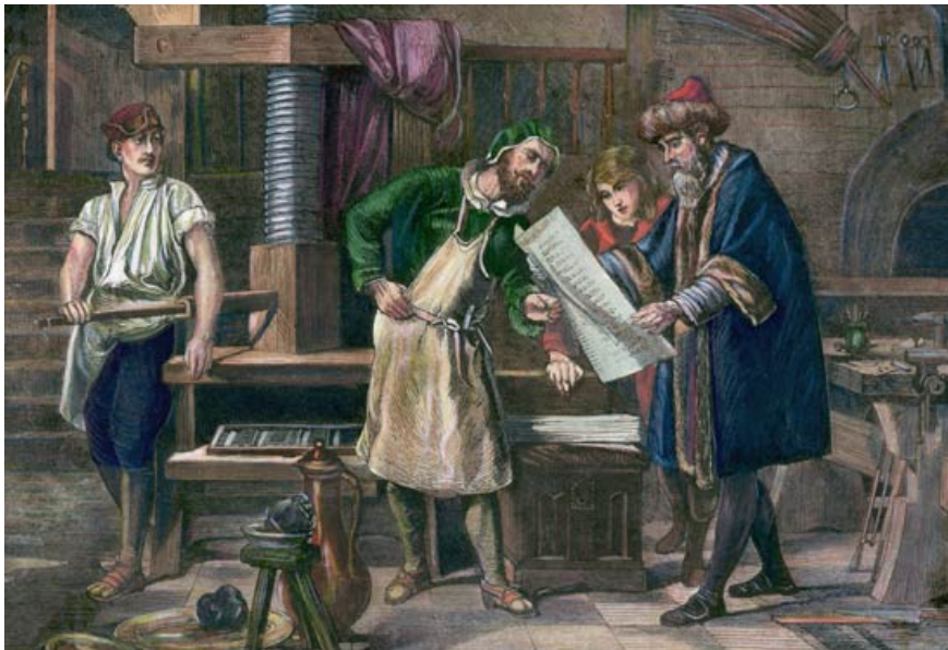
Takto to vyzeralo v Gutenbergovej tlačiarni

Tlačiť sa pokúsil už pred rokom 1440. O Gutenbergovi a jeho vynáleze nie sú žiadne reálne dokumenty, a tak rok kedy vynašiel prvý tlačiarsky stroj môžeme odhadovať na dobu od roku 1436 až 1443. Dôležitým podnetom k jeho vynálezu boli hospodárske záujmy: Gutenberg bol podnikavý, všestranne nadaný človek, so zmyslom pre umelecké remeslá. Svojim vynálezom vytvára typografický obrazec európskej tlačenej knihy. Podstatou jeho vynálezu nie je kníhtlač ako taká (tá bola vynájdená už pred ním) ale tzv. lejací prístroj. Gutenberg bol tvorcom písma a typografickej úpravy, sadzačom, ale aj tlačiárom a nakladateľom.